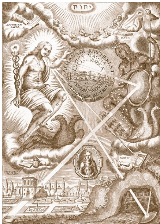
«Великое искусство света и тени» Художник Афанасий Кирхер. 1646 г.

В таких случаях хороши и многие другие средства, вроде тех, о которых я упомяну в дальнейшем, когда перейду к рассказу о бурях и временах года.