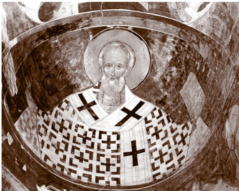
Николай Чудотворец. Ферапонтов монастырь. Дионисий. Роспись собора Рождества Богородицы