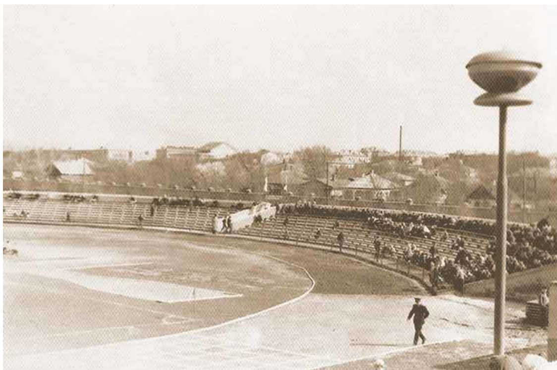
Каменск-Шахтинский, 60-е годы, стадион «Прогресс»