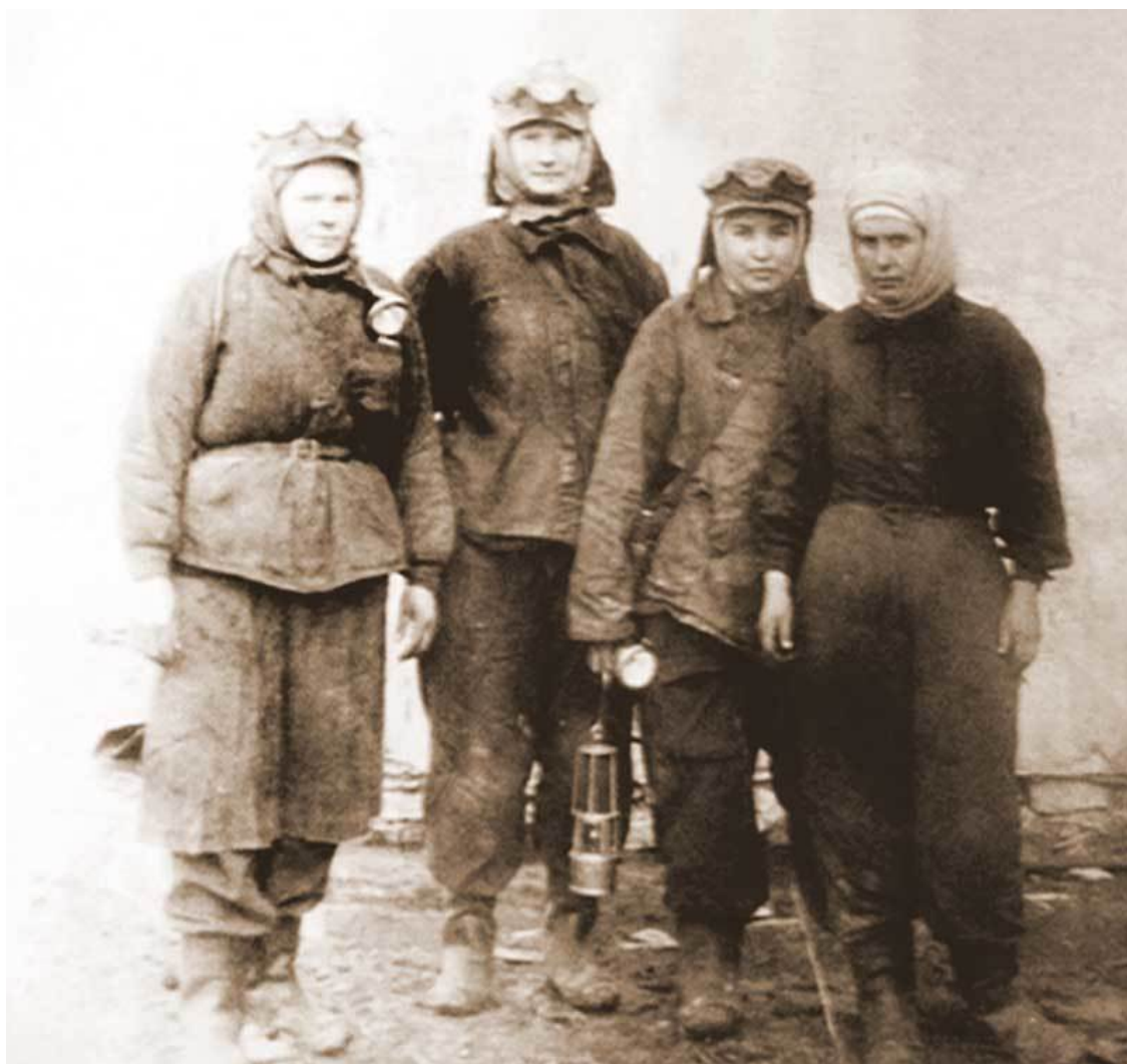
Шахтерки, 50-е годы