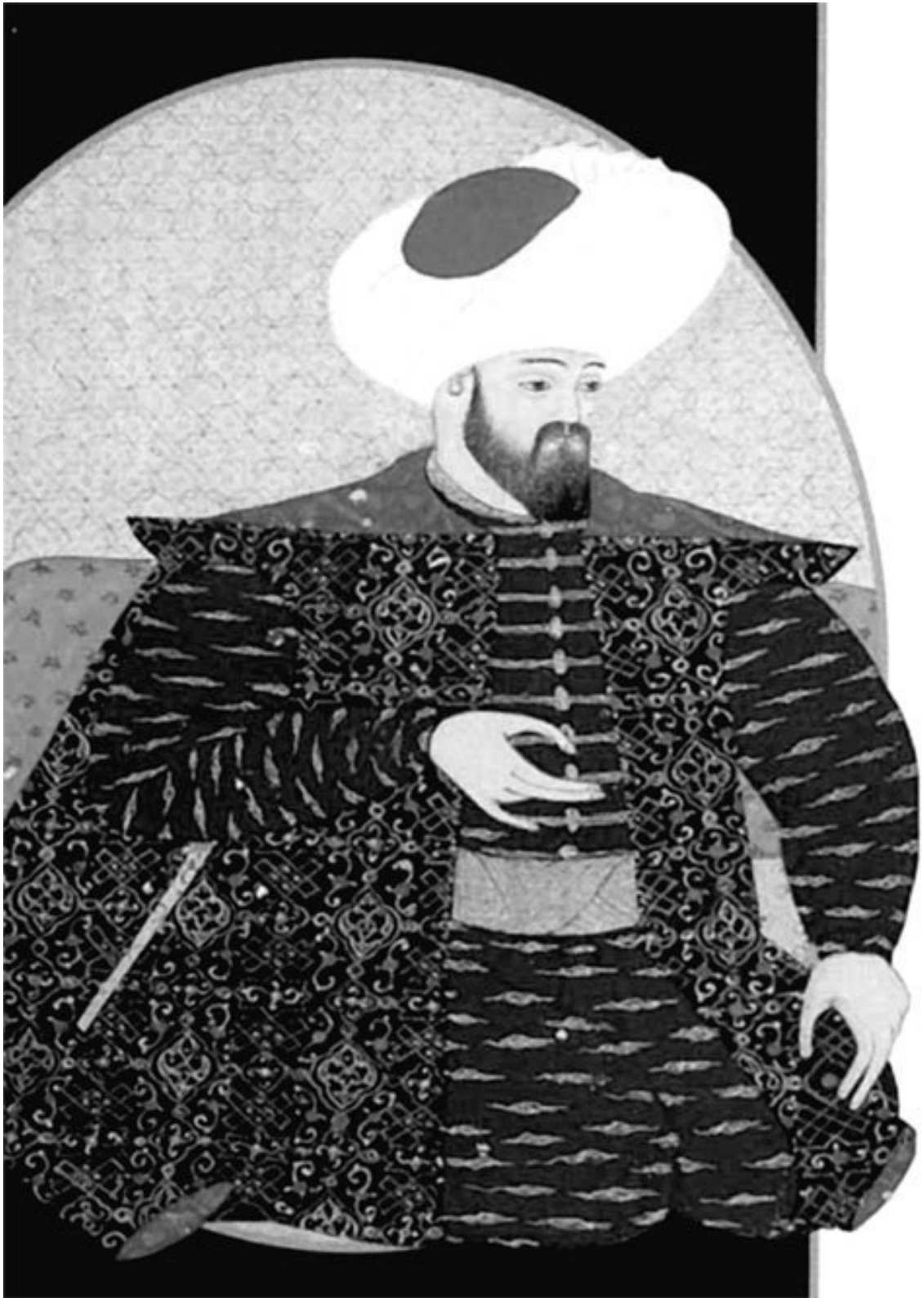
Осман I – первый османский султан, сын князя Эртогула и его турецкой наложницы Хаймы

проведена с соблюдением строжайших требований ритуала истинной веры святым дервишем, для которого Осман позже построил монастырь, пожертвовав ему богатые земли и деревни.