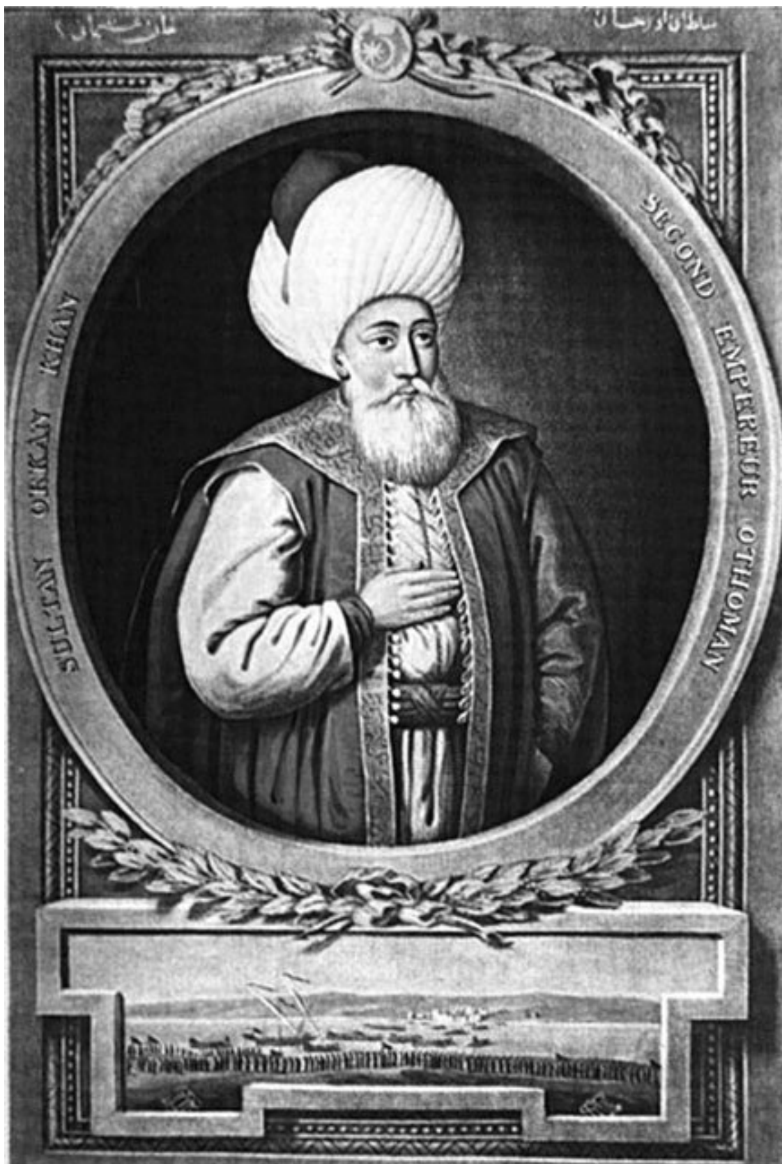
Орхан I – второй правитель османского государства, правивший с 1326 по 1359 годы