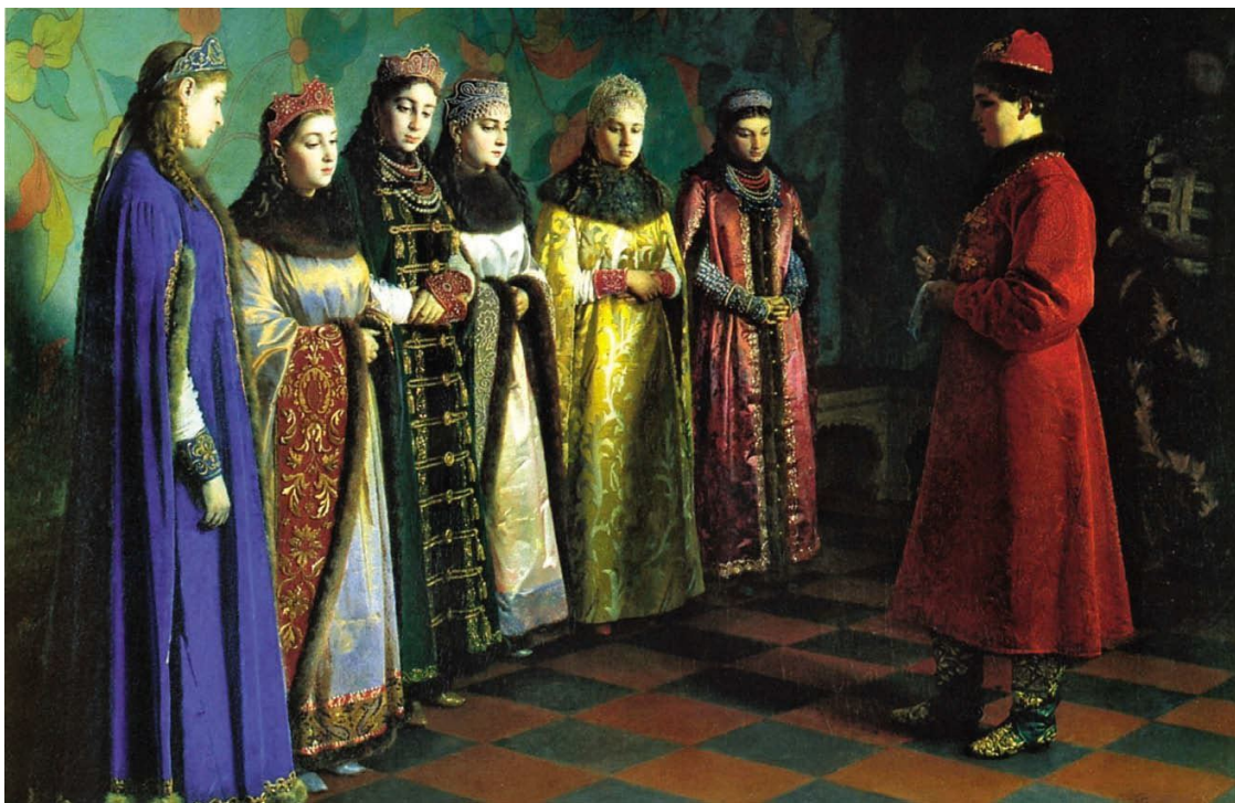
Из представленных красавиц Алексей Михайлович выбрал Евфимию, дочь помещика Всеволожского (худ. Г. С. Седов, 1882)

Пользуясь доверием царя, Морозов стал начальником нескольких важнейших приказов, в том числе Стрелецкого и Большой казны. Он ведал всеми доходами государства, в том числе с купеческой торговли, чеканкой монет, налогами и много чем еще, вплоть до аптек. Поле для злоупотреблений царскому любимцу открывалось большое. Морозов и так был нисколько не беден, являлся одним из крупнейших землевладельцев, имел собственные железные и соляные промыслы, но хотел, наверное, быть еще богаче. Кроме того, в казне хронически не хватало денег. Руководствуясь как государственными, так и личными интересами, Морозов пытался изыскивать всё новые пути получения доходов.