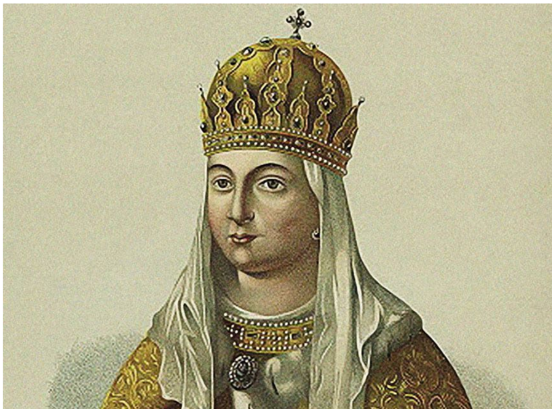
Царица Евдокия Лукьянова Стрешнева, вторая супруга Михаила Федоровича (худ П. Ф. Борель, 1860-е)

Этот брак стал для Михаила Федоровича воистину счастливым. С царицей Евдокией они жили в полном согласии и уважении, оба умерли в 1645 году, с разницей всего в полтора месяца. Правда, из десяти детей, которых родила царица, шестеро умерли во младенчестве. До зрелого возраста дожили только четверо: Ирина, Анна, Татьяна и Алексей, который занял московский трон после смерти отца.