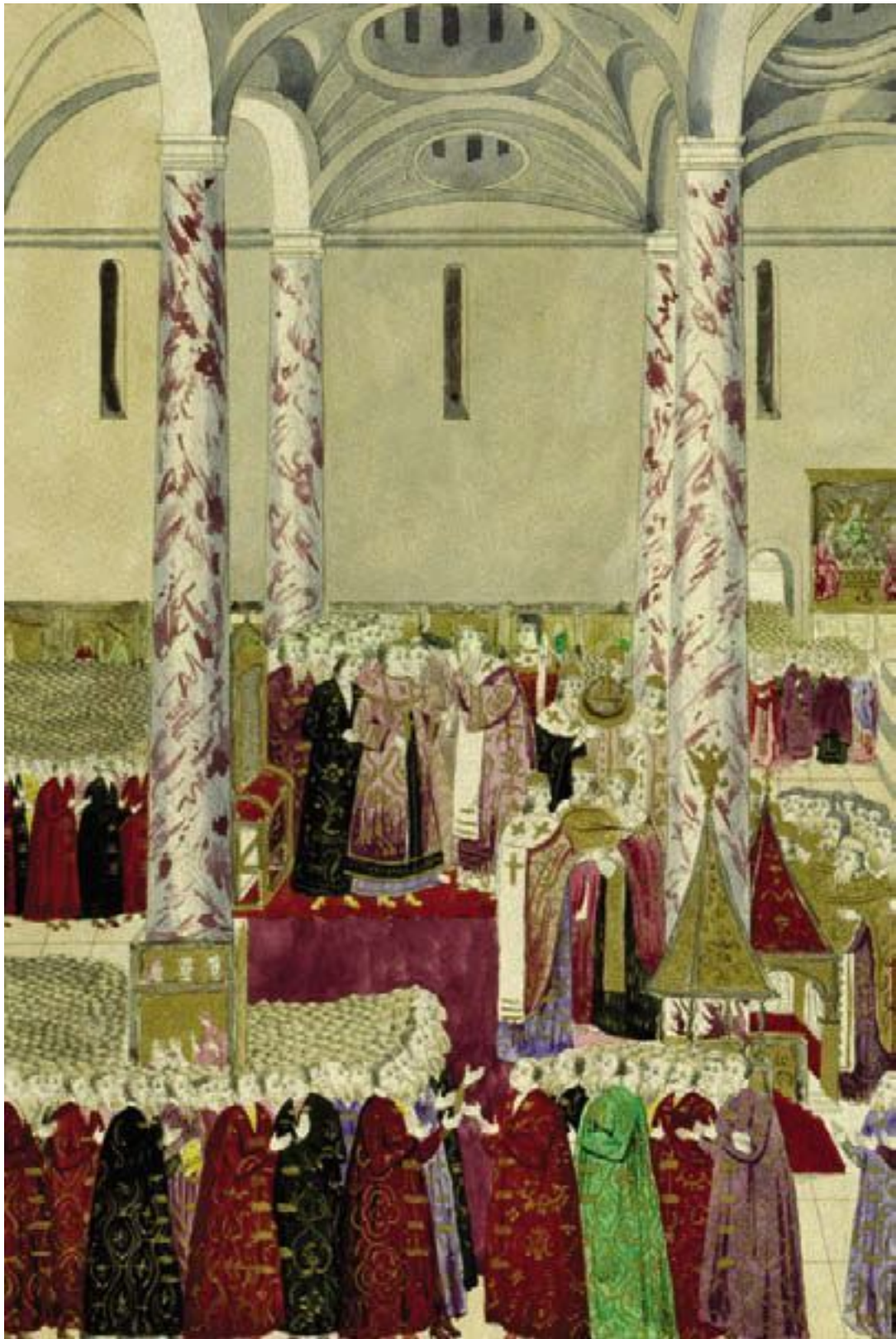
Коронавание царя Михаила Феодоровича в Успенском соборе (литография XIX в. с гравюры XVII в.)