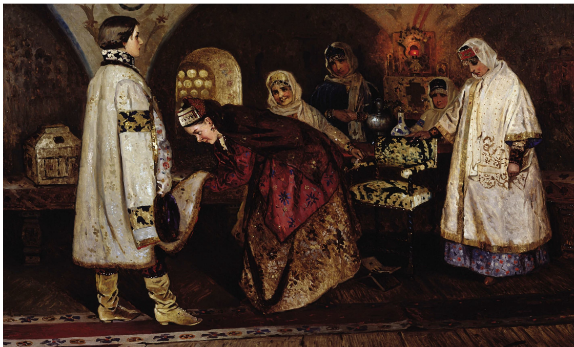
М. В. Нестеров «Первая встреча царя Алексея Михайловича с боярышней Марией Ильичиной Милославской (Выбор царской невесты)», 1887

Морозов же, по слухам, этот обморок и организовавший, обвинил отца девушки в том, что тот скрыл ее болезнь, и ни в чем не повинная семья отправилась в ссылку в Тюмень. Впоследствии Всеволожским позволили вернуться в свое имение, но без права из него выезжать. Через десять лет после несостоявшейся свадьбы Евфимия умерла.