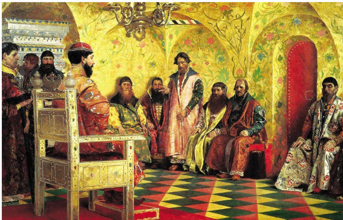
Боярская дума, разделявшая власть с царем, ежедневно заседала в одной из палат дворца (худ. А. П. Рябушкин, 1893)

Единственным взрослым мужчиной среди ссыльных был князь Борис Камбулатович Черкасский, однако никакого участия в воспитании маленького Михаила Романова он не принимал. Это было не в традициях эпохи. Будущим царем занимались в основном женщины, мамы и няньки. Однако самую заметную роль в воспитании маленького Миши сыграла княгиня Марфа Никитична Черкасская. Несомненно, женское руководство наложило отпечаток на характер будущего царя. Михаил с детских лет отличался смирением, кротким нравом и необычайной ласковостью.