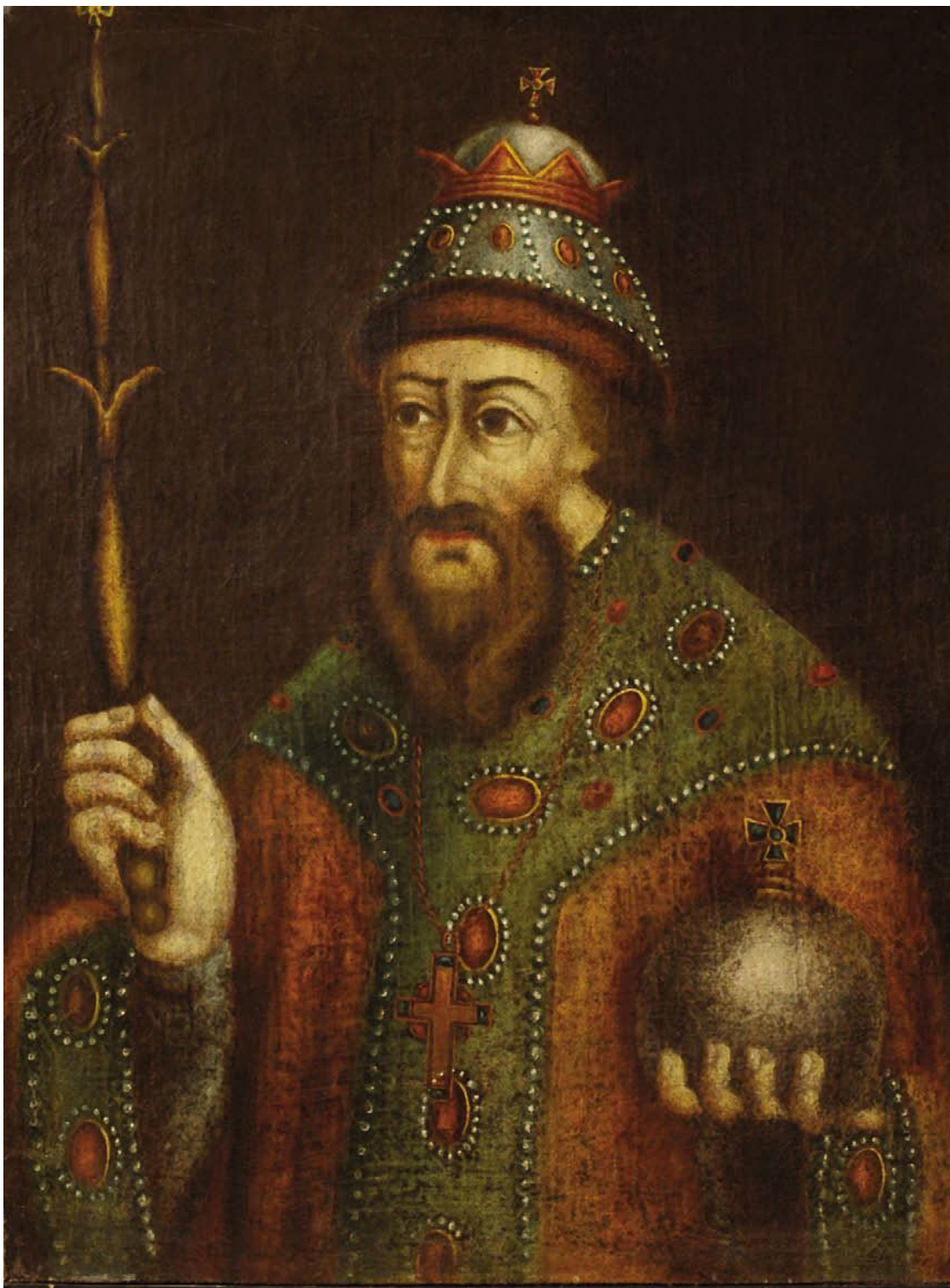
Правление Михаила Федоровича ознаменовалось «вечным миром» со Швецией и прекращением войны с Речью Посполитой (неизв. худ., XVIII в.)