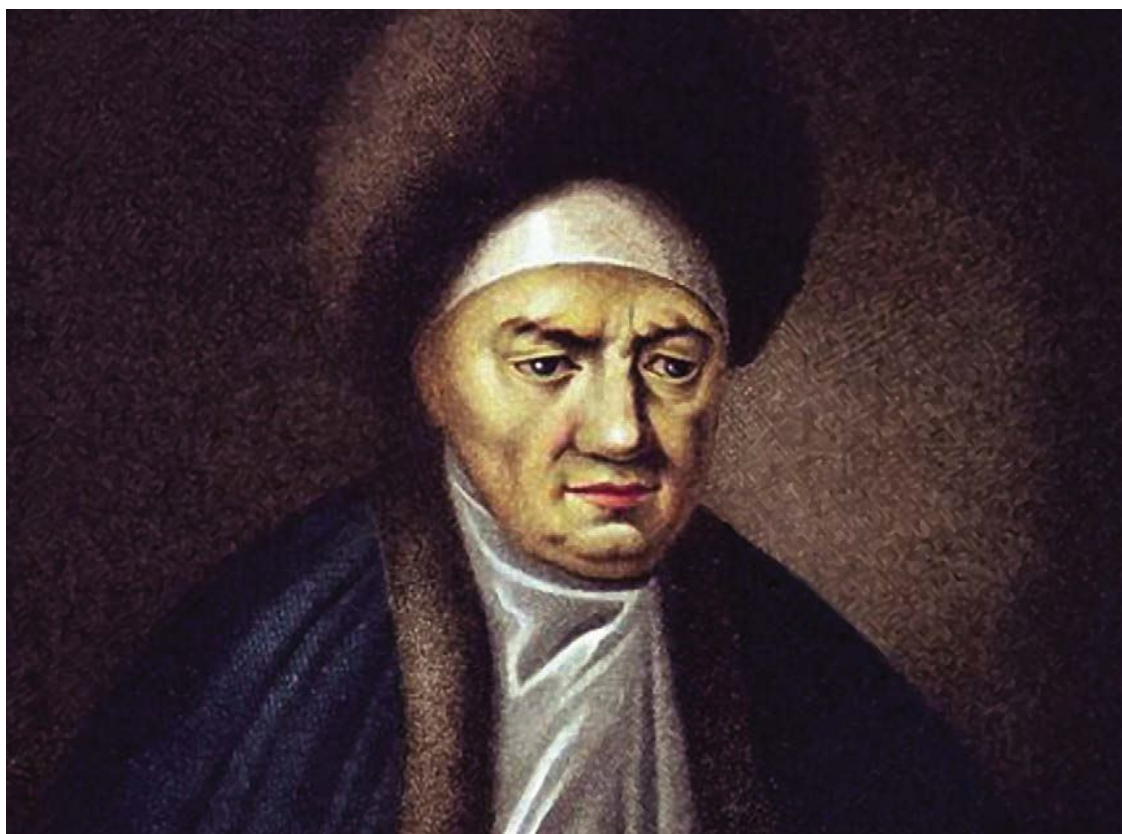
«Великая старица Марфа», мать Михаила Федоровича, была против его невесты уд. Ф. Г. Солнцев, 1770-е