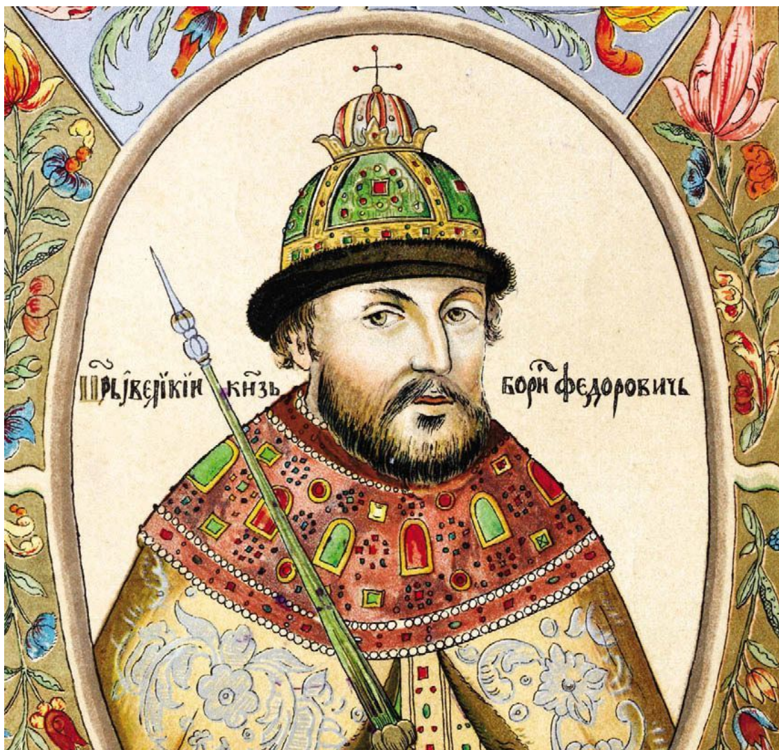
Борис Годунов ненавидел Романовых как возможных соперников на троне (илл. из «Царского титулярника», 1672)

Современники отмечали, что этот тихий, скромный и мягкий молодой человек с начала царствования не испытывал склонности ни к государственным делам, ни к державному устройству. Неудивительно, что и мать Михаила, умная и волевая инокиня Марфа, узнав о решении Земского собора, пришла в ужас. По ее мнению, сын совершенно не подходил на роль властителя огромной державы. «Люди московские измалодушествовались!» – такова была ее первая реакция. Лишь после долгих уговоров мать, скрепя сердце, согласилась благословить сына на царство.