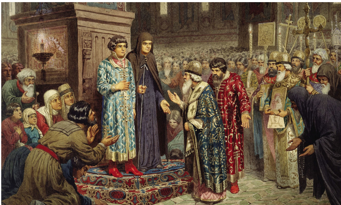
А. Д. Кившенко «Избрание Михаила Федоровича Романова на царство», 1880