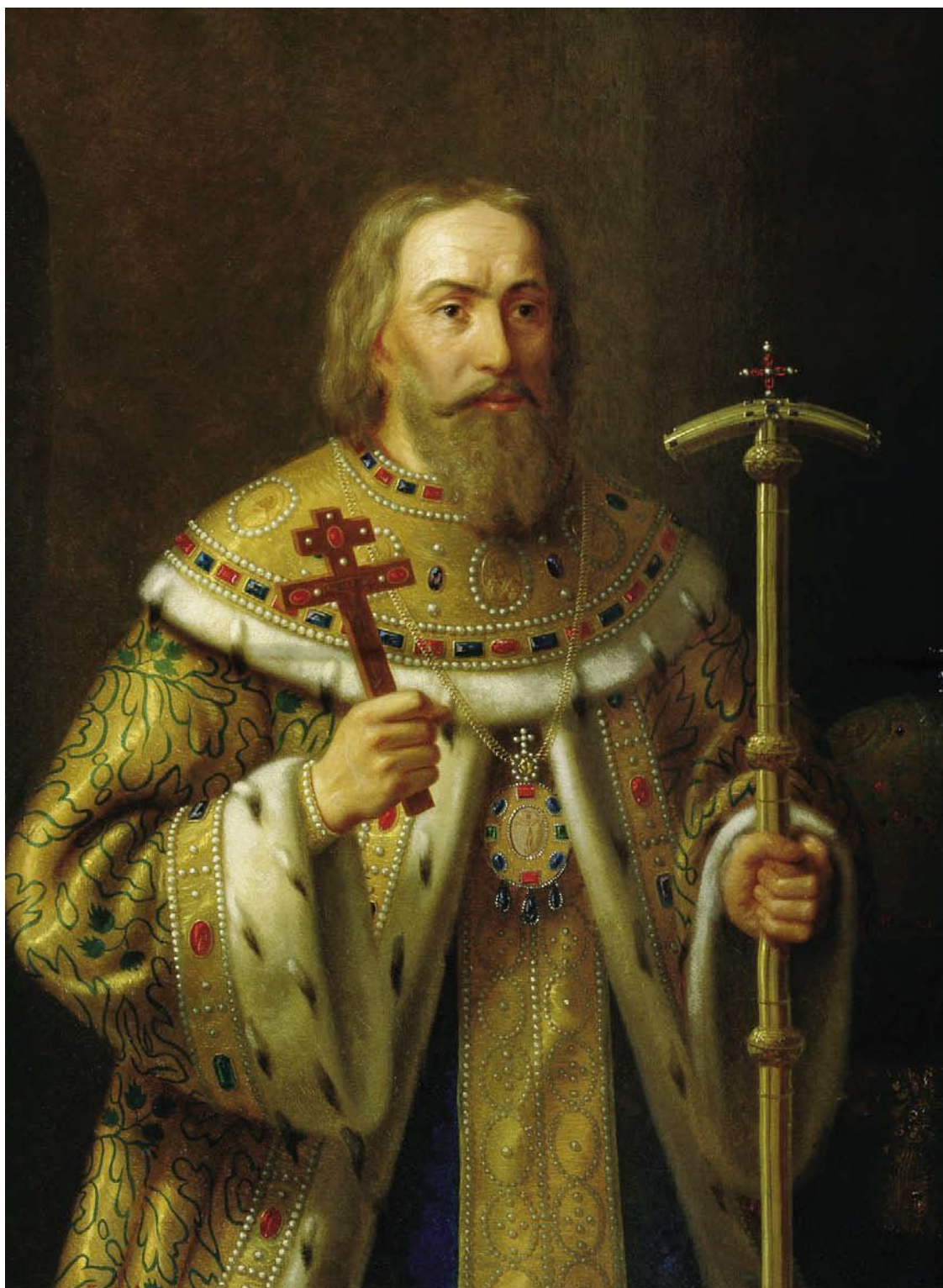
Русский кардинал Ришелье – митрополит Филарет, в миру Федор Никитич Романов, отец Михаила Федоровича (худ. Н. Л. Тютрюмов, 1870-е)

Михаил Федорович был полной противоположностью отцу и соправителю. Если молодой царь выглядел мягким и уступчивым, то Филарет – властным и жестким. Юный монарх был склонен прощать своих недругов, а Филарет никогда не спускал обид. Зато, в отличие от сына, его соправитель-отец был многоопытным тактиком и искушенным стратегом. Именно он, а не Михаил Федорович, определял как внутреннюю, так и внешнюю политику Московского царства.