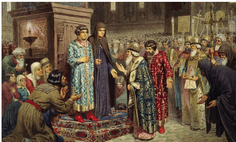
А. Д. Кившенко «Избрание Михаила Федоровича Романова на царство», 1880

решил сделать ее царицей. Невесту тут же поселили в Кремле, дали ей новое имя Анастасия, после чего весть о будущей свадьбе разнеслась по всему государству. В известность об этом были поставлены и иностранные послы. Свадьба была уже делом решенным. В царский дворец поселили бабу и мать будущей царицы, а также всех прочих ее близких родственников.