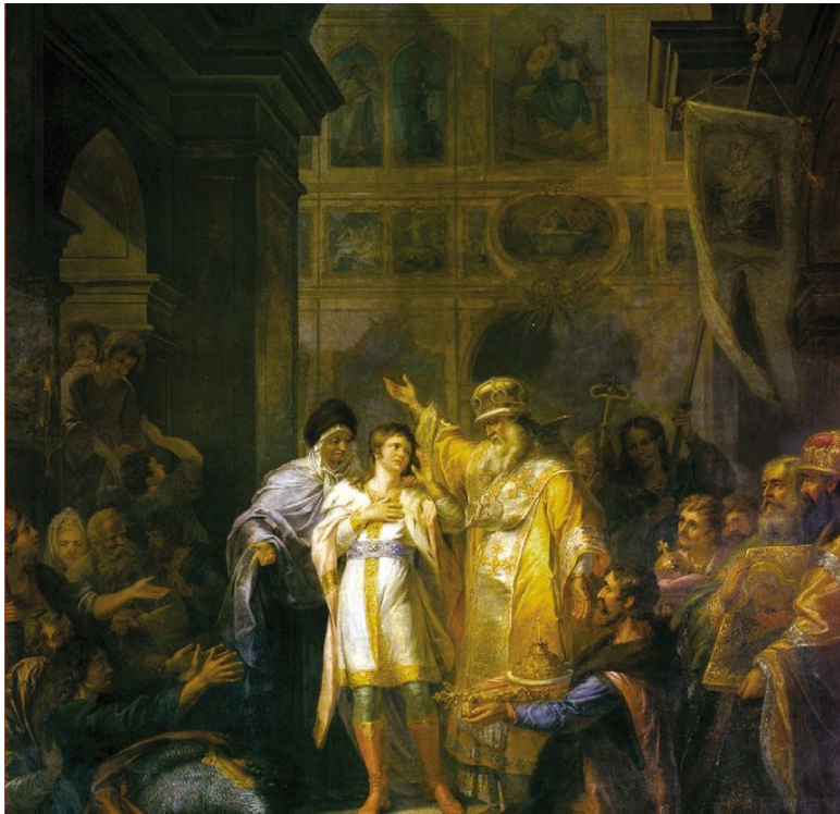
Г. И. Угрюмов «Призвание на царство Михаила Федоровича Романова 14 марта 1613 года» (1799)

Однако Михаил Федорович и тут проявил просто каменную непреклонность. В качестве царицы и матери престолонаследника он видел лишь ту, которую любил до сих пор. Беспристрастный летописец сохранил для потомков его до-