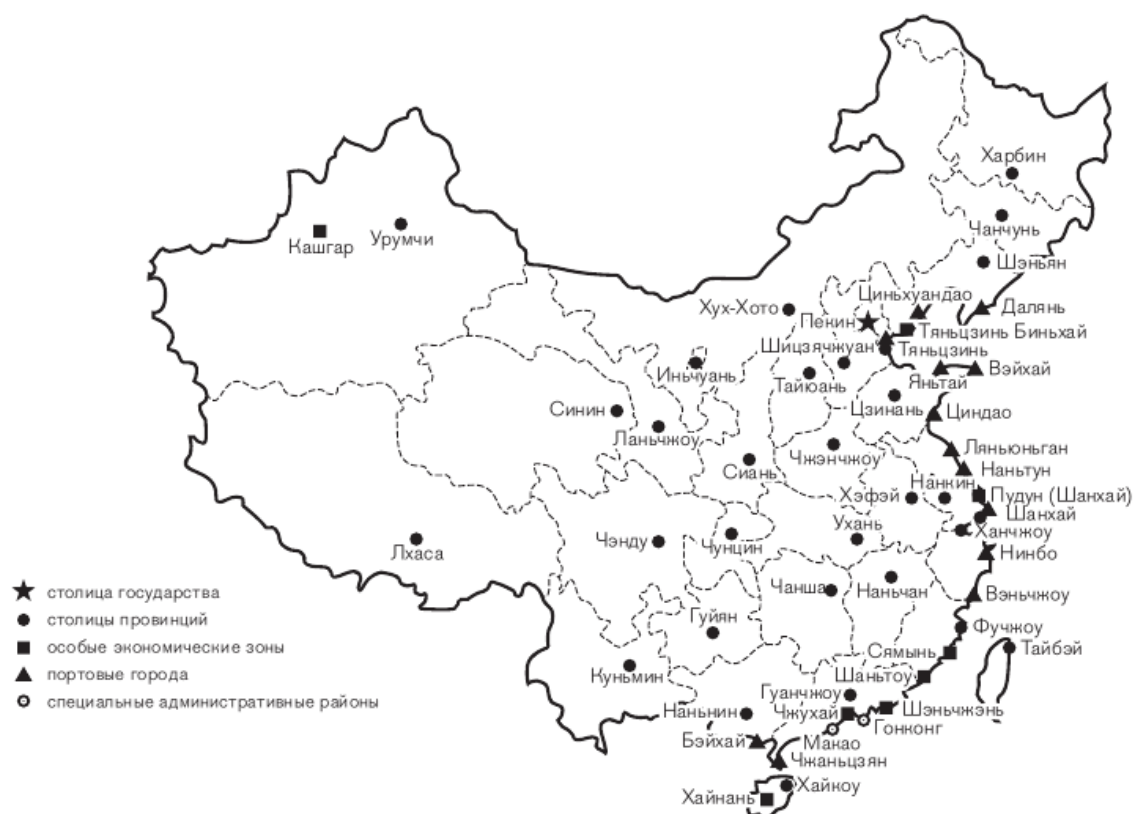
Административное деление КНР (С особыми экономическими зонами)