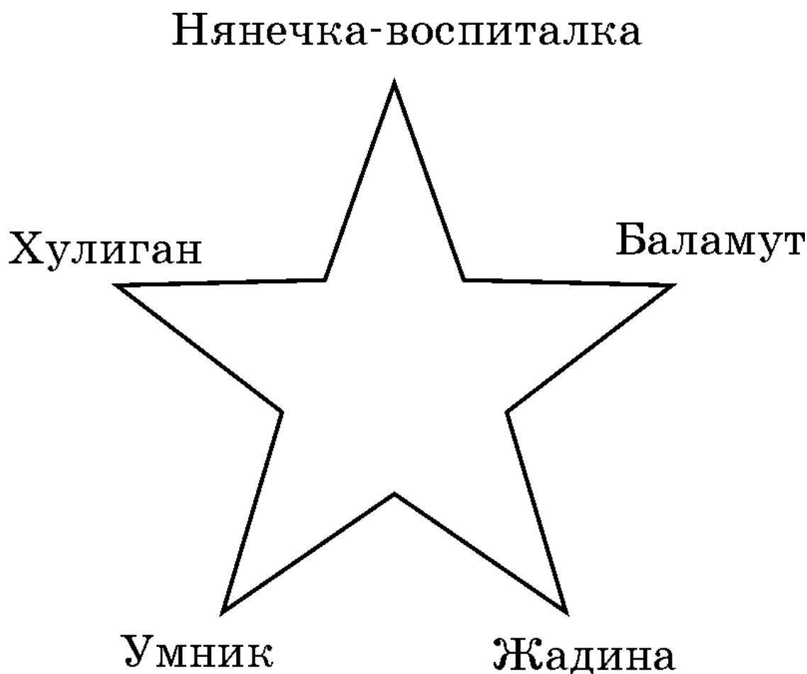
Рис. 2. Звезда архетипов в шутильной форме

Они есть в каждом из нас. В каждом живут и свой «баламут», и свой «хулиган». В каждом есть и «жадина», и «умник». И, наконец, в каждом присутствует та самая «нянечка-воспиталка», которая поставлена следить за всем этим «детским садом».