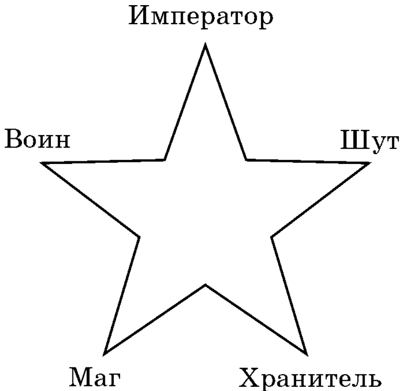
Рис. 4. Звезда архетипов в классическом обозначении