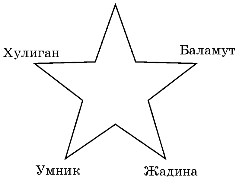
Рис. 2. Звезда архетипов в шутливой форме

До тех пор, пока все эти ваши структуры не будут, во-первых, заниматься каждая своим делом, во-вторых, согласованно взаимодействовать, как гребцы в лодке из второй метафоры, в вашей внутренней и внешней жизни будут лишь бардак, хаос и, как принято говорить, раздрай. И тогда вам не помогут никакие тренинги, никакие тренеры, никакая целестановка и никакая сила воли.