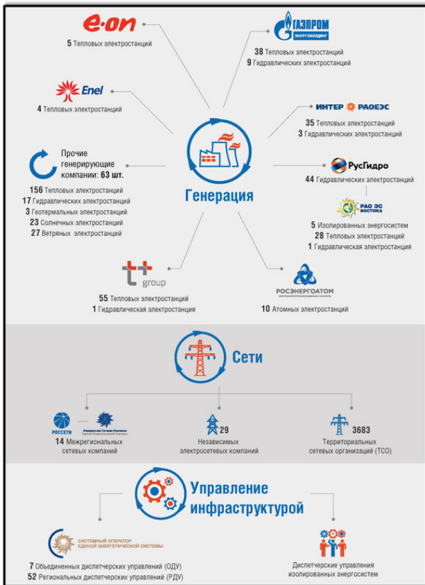
Рисунок В.1. Структура электроэнергетической системы России