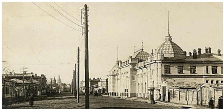
Здание Клуба Октябрьской революции (Клуба совслужащих). Сейчас – ул. Ленина, 23

лись среди населения по профсоюзной линии. Зал был полон, на улице толпились любопытствующие.