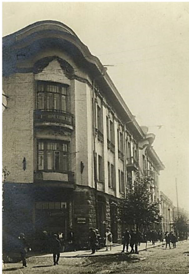
Здание, в котором в 1926 г. располагался иркутской губернский комитет ВКП(б). Сейчас – ул. К. Маркса, 28