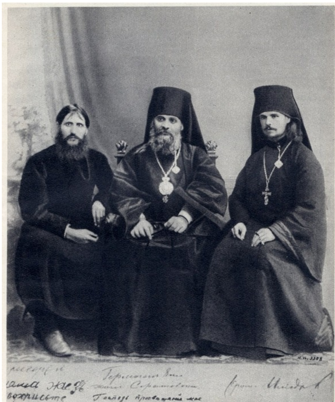
Григорий Распутин и Илиодор.