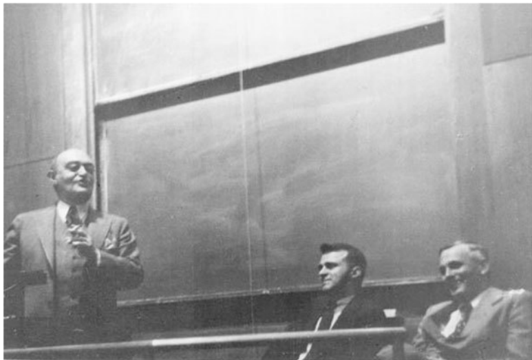
Рис. 1.3. Йозеф Шумпетер, Василий Леонтьев и Пол Сузи в Гарварде, конец 1940-х гг.

Фоули: Вы говорили о проблеме денег и ресурсов. Была ли в США в 1950-х гг. конкуренция за ресурсы между методом, традиционно применяемым для расчета национального дохода, и методом «затраты – выпуск»?