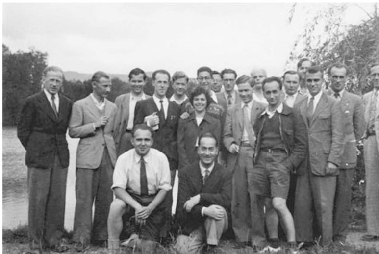
Рис. 1.2. Участники семинара профессора Леонтьева (август 1948 г., Зальцбургский семинар по американским исследованиям): 1) Фридрих Зайб (Германия), 2) Бьёрн Ларсен (? Норвегия), 3) Хельге Зейп (Норвегия), 4) Лендерт Койк (? Голландия), 5) Жерар Дебрё (Франция), 6) Поль Виндинг (Дания), 7) Роберт Солоу (США), 8) Миссис Роберт Солоу (США), 9) Марио ди Лоренцо (Италия), 10) Арво Пуукари (Финляндия), 11) Жак Мэйе (Франция), 12) Одд Аукруст (Норвегия), 13) профессор Уильям Райс (США), 14) Джозеф Клацман (Франция), 15) неизвестный (Германия), 16) Бьярк Фог (Дания), 17) профессор Василий Леонтьев (США), 18) Пер Сильве Твейте (Норвегия)