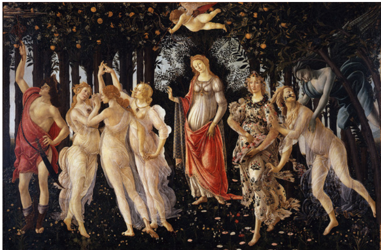
Сандро Боттичелли. Весна. 1482. Галерея Уффици, Флоренция