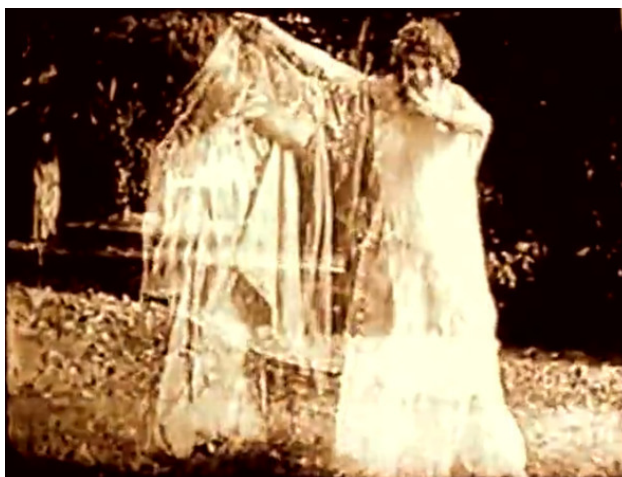
«Падение Трои», 1911. Авторы: режиссер и сценарист Джованни Пастроне; режиссер Луиджи Боргнетто; сценаристы, Гомер и Публий Вергилий Марон

Важным пластическим свойством божественного киноглаза с ранних лет жизни является его неуязвимость. К примеру, в «Падении Трои» ( La caduta di Troia , 1910) Джованни Пастроне наивная аттракционность в духе ярмарочного кино – допустим, перенесение по воздуху Елены и Париса в Трою – соседствует со сценами битв, решенными в жизнеподобном духе.