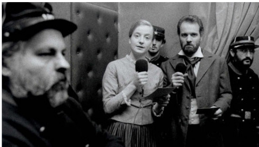
«Коммуна», 2000. Авторы: режиссер и сценарист Питер Уоткинс; сценарист Агат Блюйсен

«Народ» же кричит в камеру все, что он думает о правительстве и своих правах, ничуть не дивясь самой камере. Действует условное допущение существования телевидения в конце XIX века. Массовые сцены и интервью прерываются выпусками новостей «Версальского телевидения», в кадре возникает лохотонный господин с галстуком-бабочкой... Весь этот абсурд не кажется абсурдом или пародией на документальность, поскольку режиссер задает тон святой веры в правомерность происходящего. Все средства хороши, если они способствуют постижению драмы исторического момента.