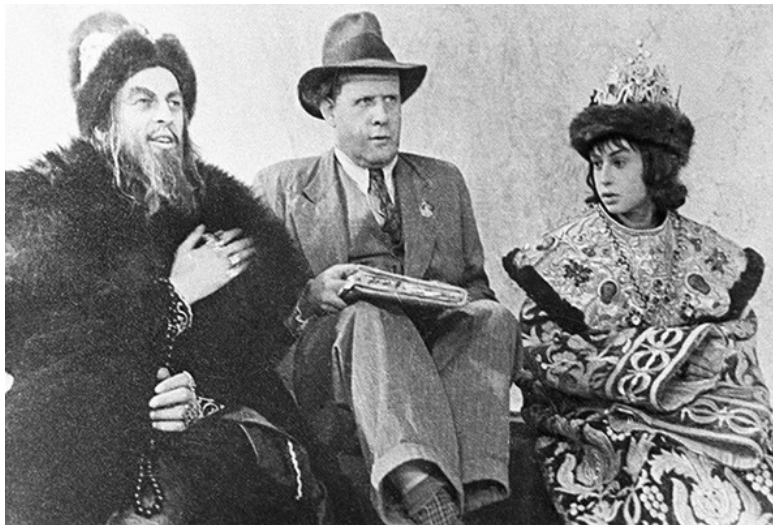
«Иван Грозный», 1944. Авторы: режиссер и сценарист Сергей Эйзенштейн; композитор Сергей Прокофьев

Верховный мифотворец с большим удовлетворением осмотрел первую серию фильма. Ту, где молодой, энергичный царь, не ведая сомнений и колебаний, не советуясь с совестью, утверждался на престоле ценой беспримерной жестокости.