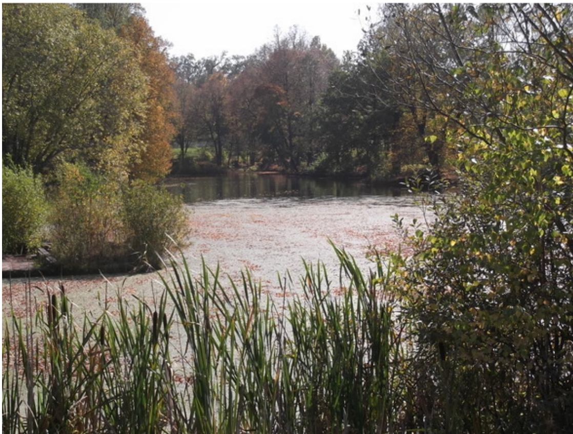
Листопад на воде

...Тихим вечером, звездным вечером, бродит по лесу листопад... (Юрий Визбор)