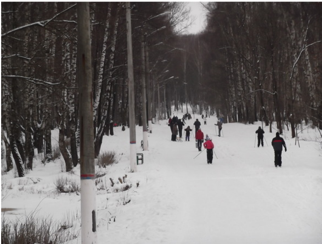
В зимнем парке