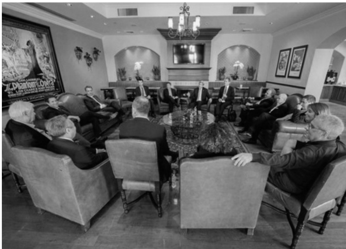
Встреча госсекретаря Джона Керри с главами голливудских студий (фото из Twitter-аккаунта политика)

Последняя из известных встреч между сотрудниками администрации президента и представителями Голливуда состоялась 16 февраля 2016 г. Вице-президент Джон Керри общался полтора часа с двенадцатью главами медиахолдингов и крупных киностудий [10] . Беседа прошла спустя два месяца после массового убийства в Сан-Бернардино, ответственность за которое взяла на себя террористическая группировка ИГИЛ (запрещена в России). По инсайдерским свидетельствам, на встрече с Керри была предпринята попытка выработать контрпропагандистские приемы по противостоянию ДАИШ (другое название ИГИЛ (запрещена в России)). Было предложено шире задействовать пострадавших и тех, кто жил на территориях, подконтрольных террористам. Участники встречи также обсудили вопросы международного маркетинга теле- и кинопродукции и задачи взаимопроникновения культур. Встреча, проходившая в компании Universal, смогла состояться благодаря тесным контактам Джона Керри и главы МРАА Криса Додда, которые проработали вместе 26 лет в стенах сената.