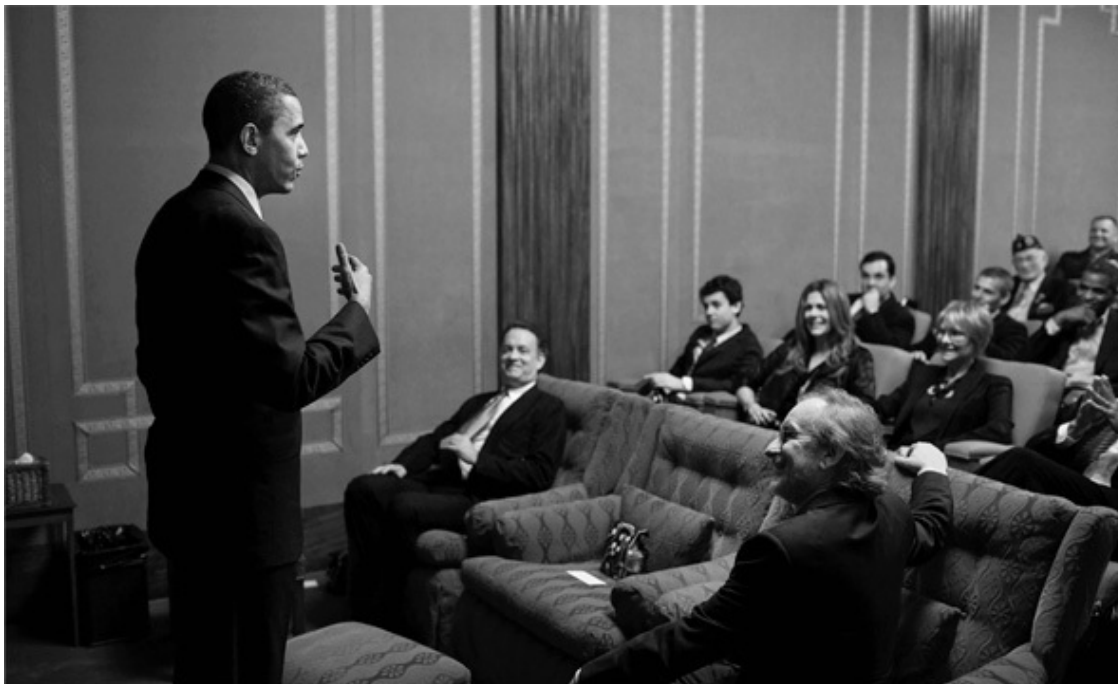
Барак Обама, Стивен Спилберг и Том Хэнкс в кинотеатре Белого дома перед показом мини-сериала «Тихий океан». 11 марта 2010 г.

том числе политического характера, работает на благосостояние корпорации в целом, помогая держать на плаву формально убыточные секторы.