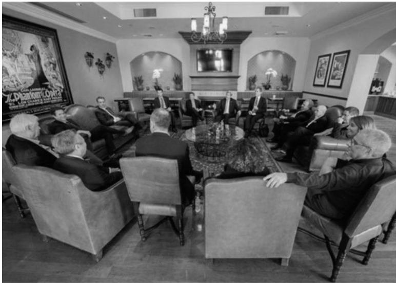
Встреча госсекретаря Джона Керри с главами голливудских студий

Последняя из известных встреч между сотрудниками администрации президента и представителями Голливуда состоялась 16 февраля 2016 г. Вице-президент Джон Керри общался полтора часа с двенадцатью главами медиахолдингов и крупных киностудий [10] . Беседа прошла спустя два месяца после массового убийства в Сан-Бернардино, ответственность за которое взяла на себя террористическая группировка ИГИЛ (запрещена в России). По инсайдерским свидетельствам, на встрече с Керри была предпринята попытка выра-