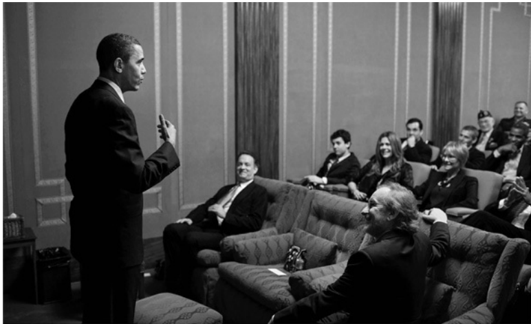
Барак Обама, Стивен Спилберг и Том Хэнкс в кинотеатре Белого дома перед показом мини-сериала «Тихий океан». 11 марта 2010 г.