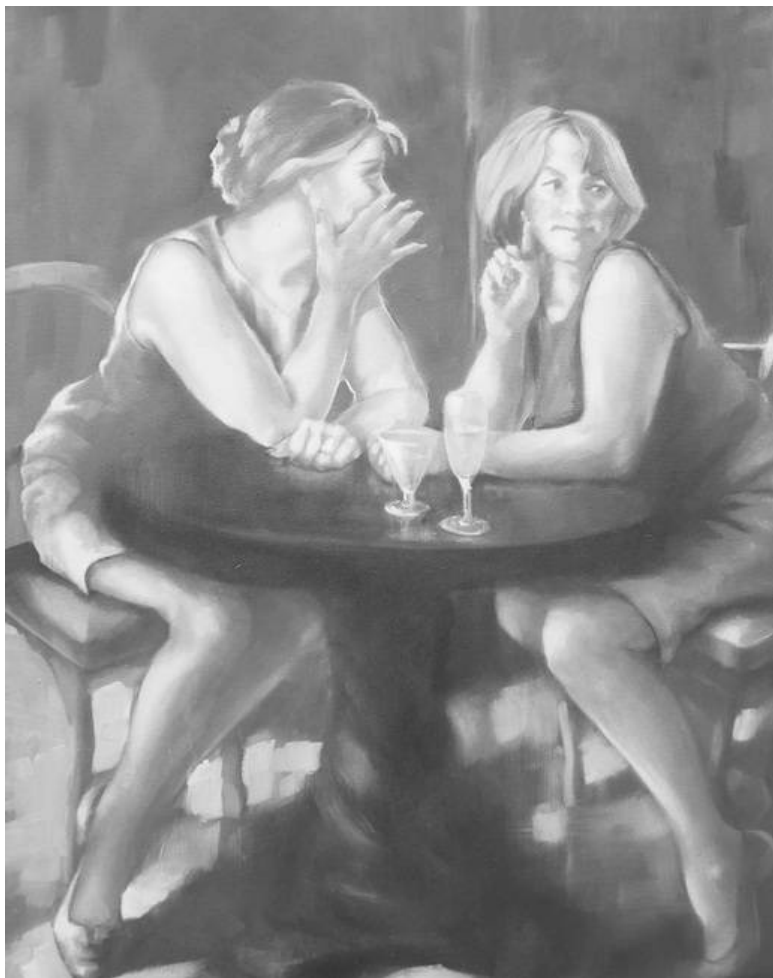
«Яблонька» – маленькое кафе прямо под боковой стеной