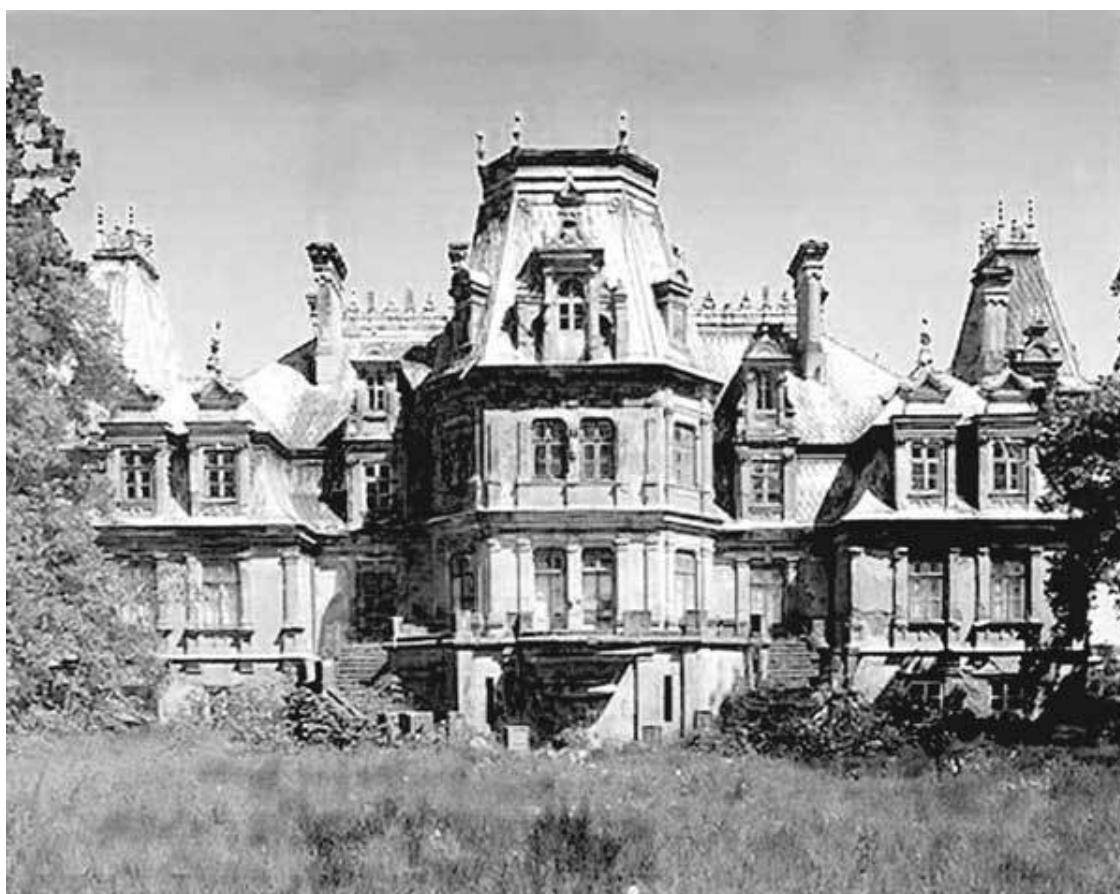
Имение Огинских в Гузове