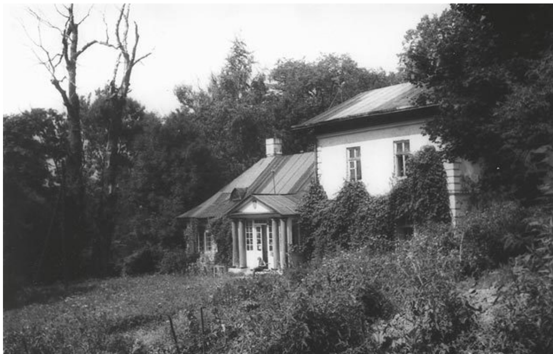
Имение в Ладзине. Около 1980 г.

Особенной популярностью в Ладзине пользовался Шопен. Когда исполнялась музыка Шопена, возникало чувство, что именно из таких маленьких поместий, как Ладзин, молодые поляки отправлялись на сражения великого восстания 1830 года, трагический исход которого был для Шопена столь значим, либо воевали в не менее трагичном восстании 1863 года.