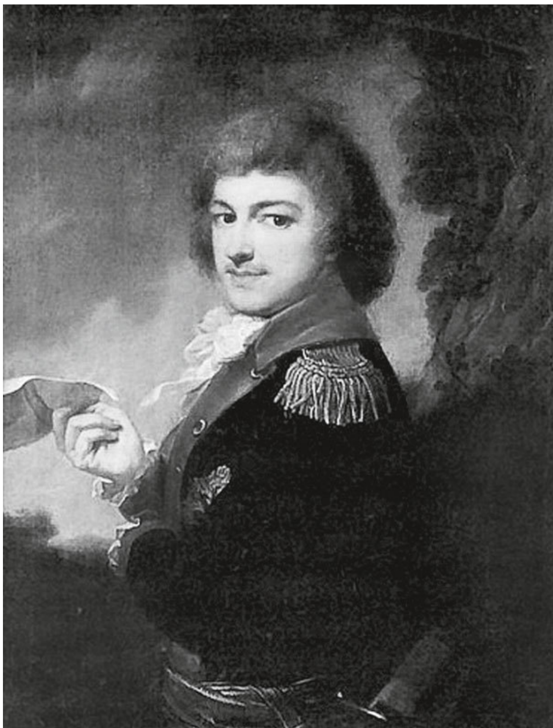
М. К. Огинский

К тому же при чтении мемуаров создается впечатление, что во время непродолжительной своей жизни в имении в Залесье он вел спокойную жизнь, сочиняя музыку и предаваясь размышлениям. Это совсем не так. Его стиль жизни там можно лучше всего определить как нечто среднее между жизнью Алека Гиннеса в классическом фильме пятидесятых годов «Рай капитана» и жизнью Людовика XIV, описанной в мемуарах герцога Сен-Симона.