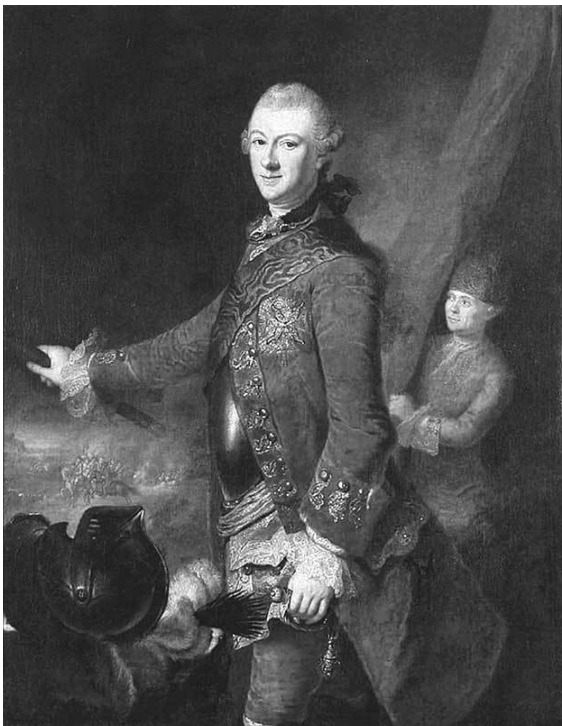
Портрет Михала Казимира Огинского. Художник А. Лишевска

Гетман Михал Казимир однажды даже нанес поражение русским войскам во второстепенном по своему значению сражении, но позже этот успех был омрачен тем, что он по оплошности дал возможность ставшему впоследствии знаменитым Суворову напасть на него ночью и разогнать его войско.