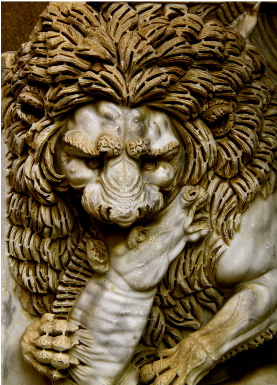
Внутренний дворик дворца Бельведер, Ватикан