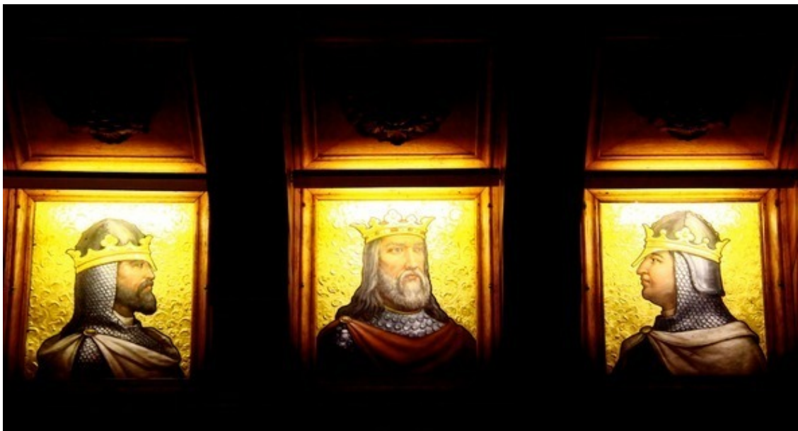
Кинта да Регалейра, Синтра, Португалия

Вождь – это тот, кто делает из толпы разумную группу людей. Он должен рассматривать каждого человека как личность, и тогда неуправляемое стадо людей превращается в дружную семью.