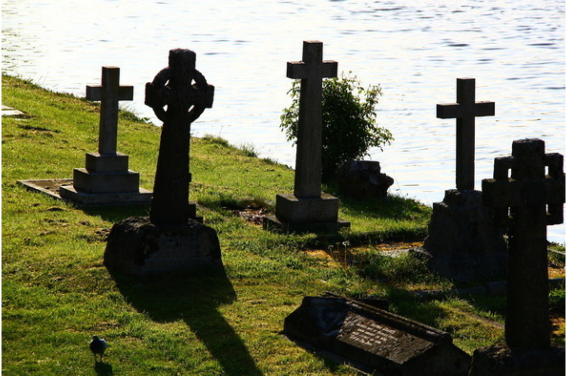
Марлоу, Бакингершир, Великобритания

«Я» человека всегда стремится быть центром вещей.