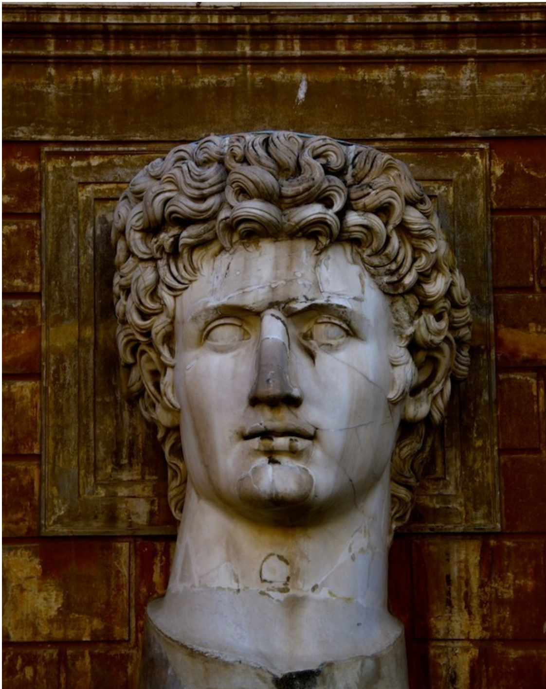
Голова от колоссальной статуи Августа, Двор сосновой шишки, Ватикан

Мне всегда все удавалось неплохо – потому-то меня и ненавидели.