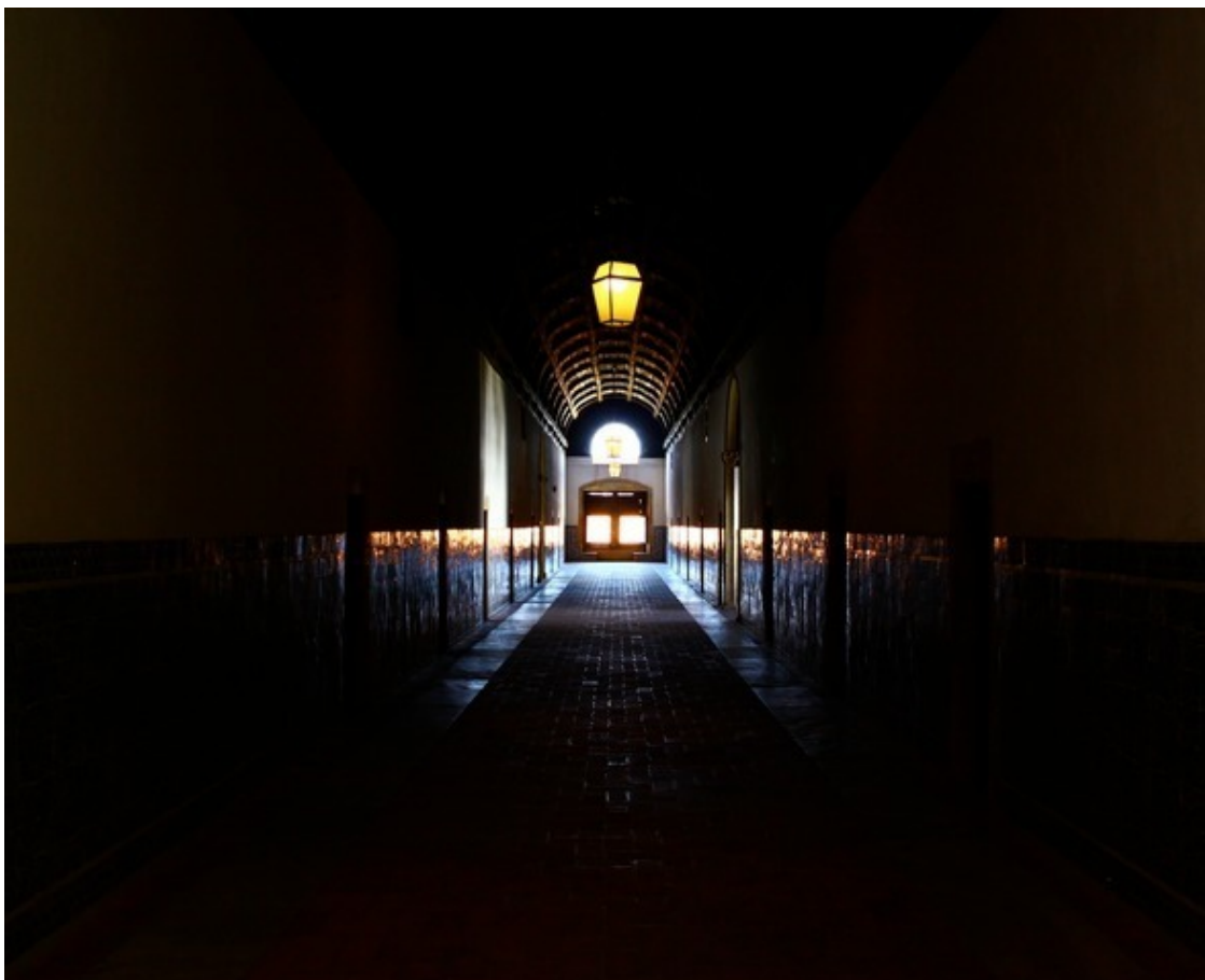
Монастырь ордена Христа, Томар, Португалия

Люди могут начинать и заканчивать существование разными путями, – ... – Некоторые могут начинать как машины и понемногу добывать себе человечность. Другие могут заканчивать как машины, теряя человечность понемногу в течение жизни. Потерянное всегда можно вернуть, приобретённое всегда можно потерять.