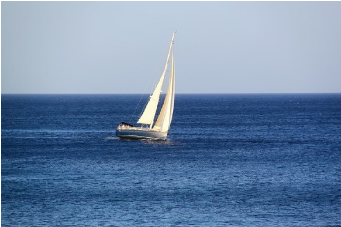
Средиземное море, Мальта

Неприятности часто приобретаются дёшево, но счёт за них может оказаться выше, чем вы смогли бы оплатить.