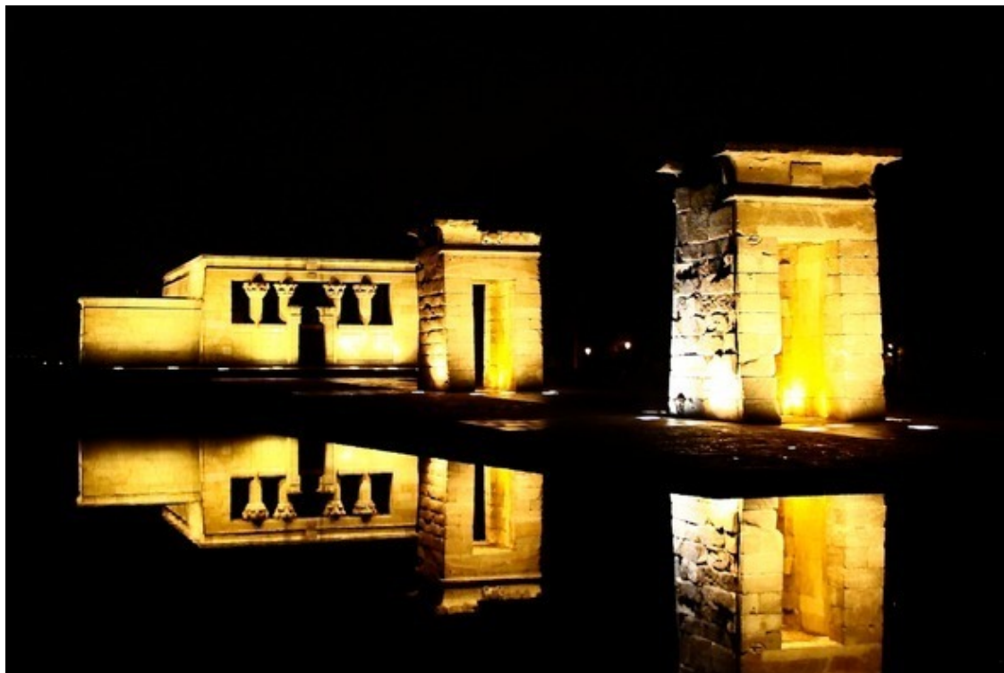
Храм Дебод, Западный парк, Мадрид, Испания

...понимание вовсе не обязательное условие, чтобы иметь возможность оценить что-либо по достоинству.