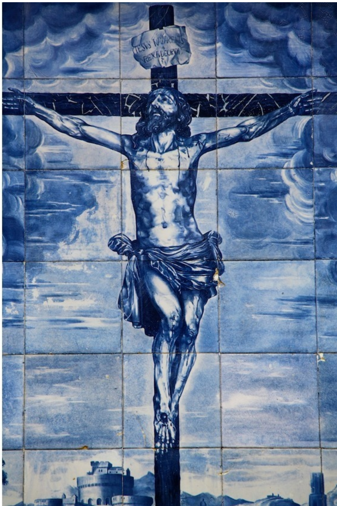
Асулехос, Севилья, Испания