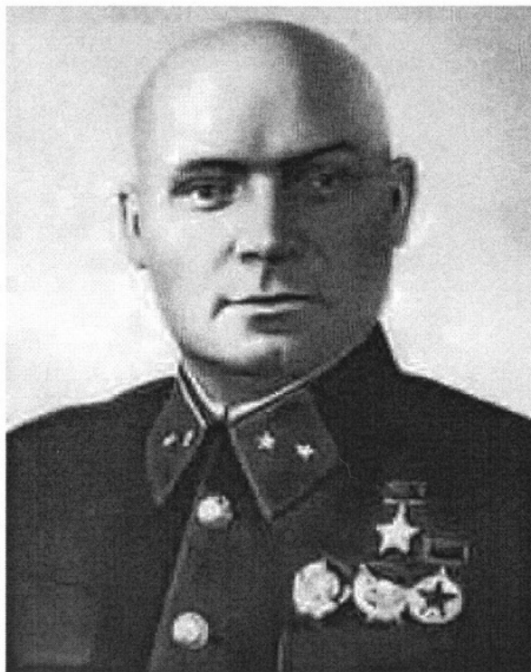
Командующий 5-й армии Западного фронта генерал Дмитрий Данилович ЛЕЛЮШЕНКО, Герой Советского Союза (1941 год).