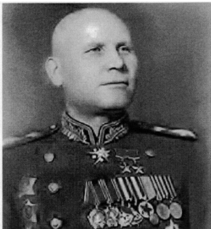
Маршал Советского Союза Иван Степанович КОНЕВ, командующий 1-м Украинским фронтом, дважды Герой Советского Союза, удостоен высших наград Соединенных Штатов Америки, Великобритании, Франции и других государств.