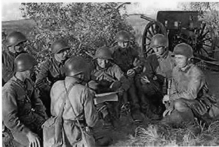
Боевые действия с японцами у озера Хасан. Бойцы 32-й Краснознаменной стрелковой дивизии в короткие минуты затишья (1938 год).