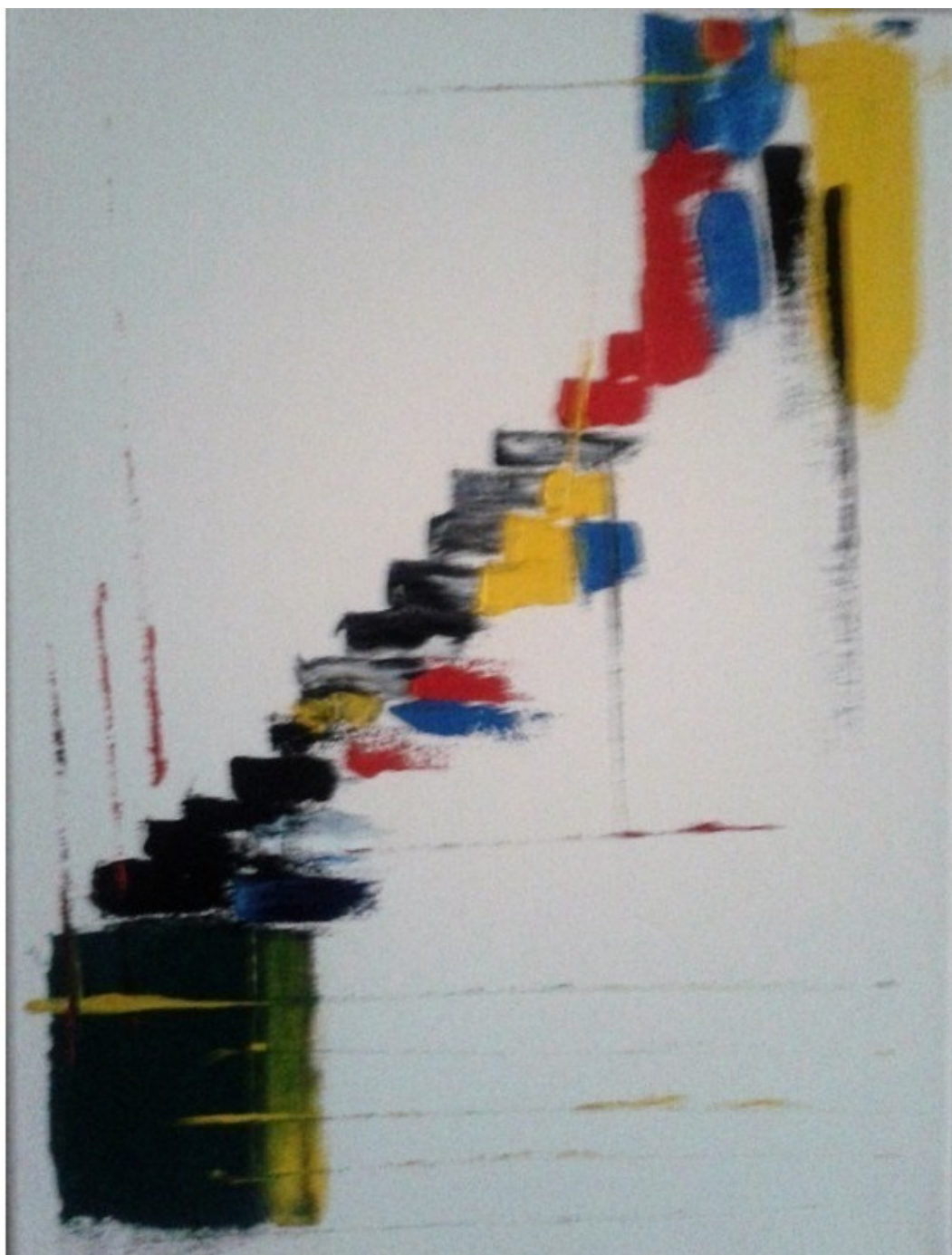
Холст 30x40, масло, мастихин