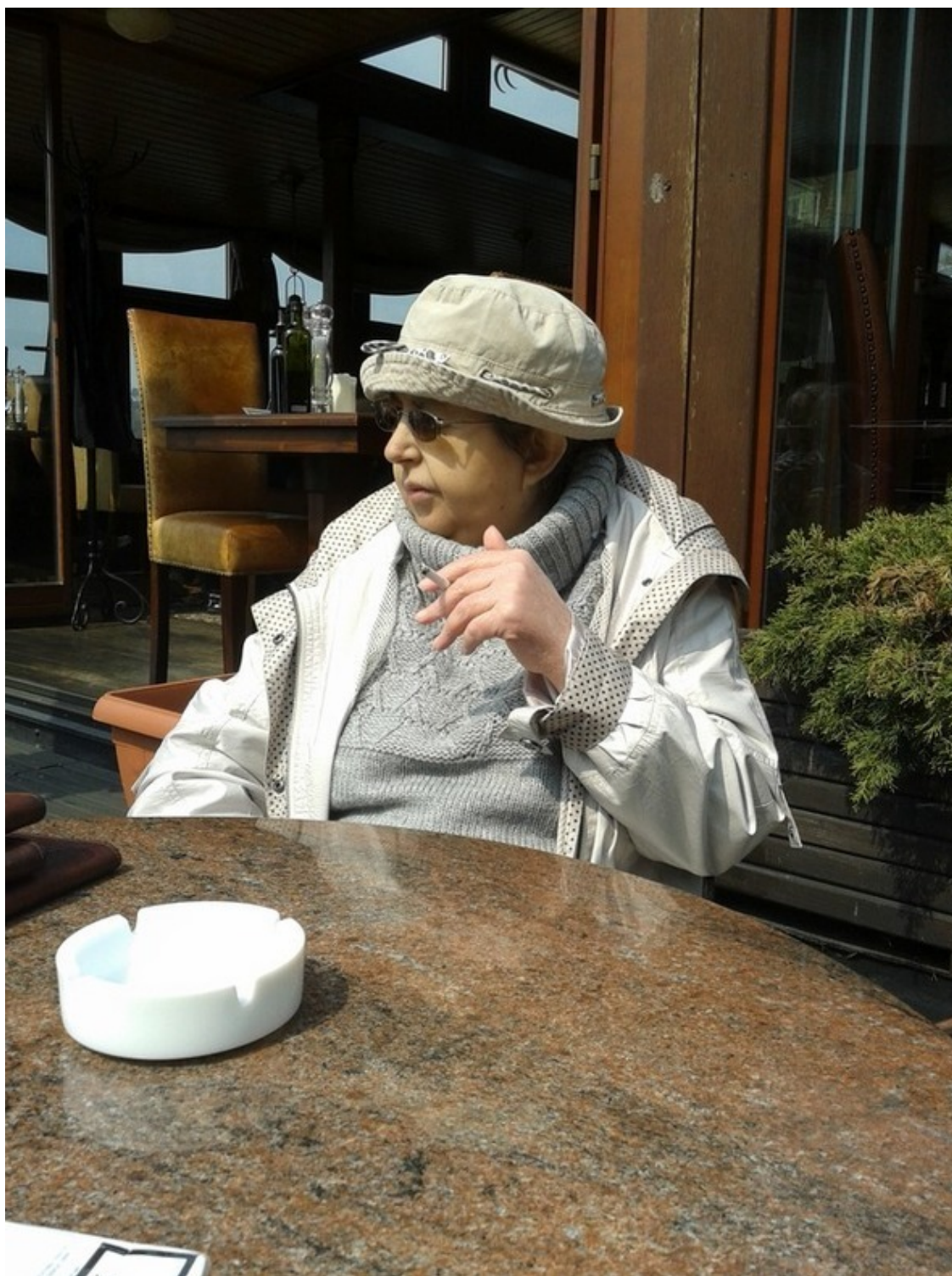
Прага, 22 апреля 2013 года