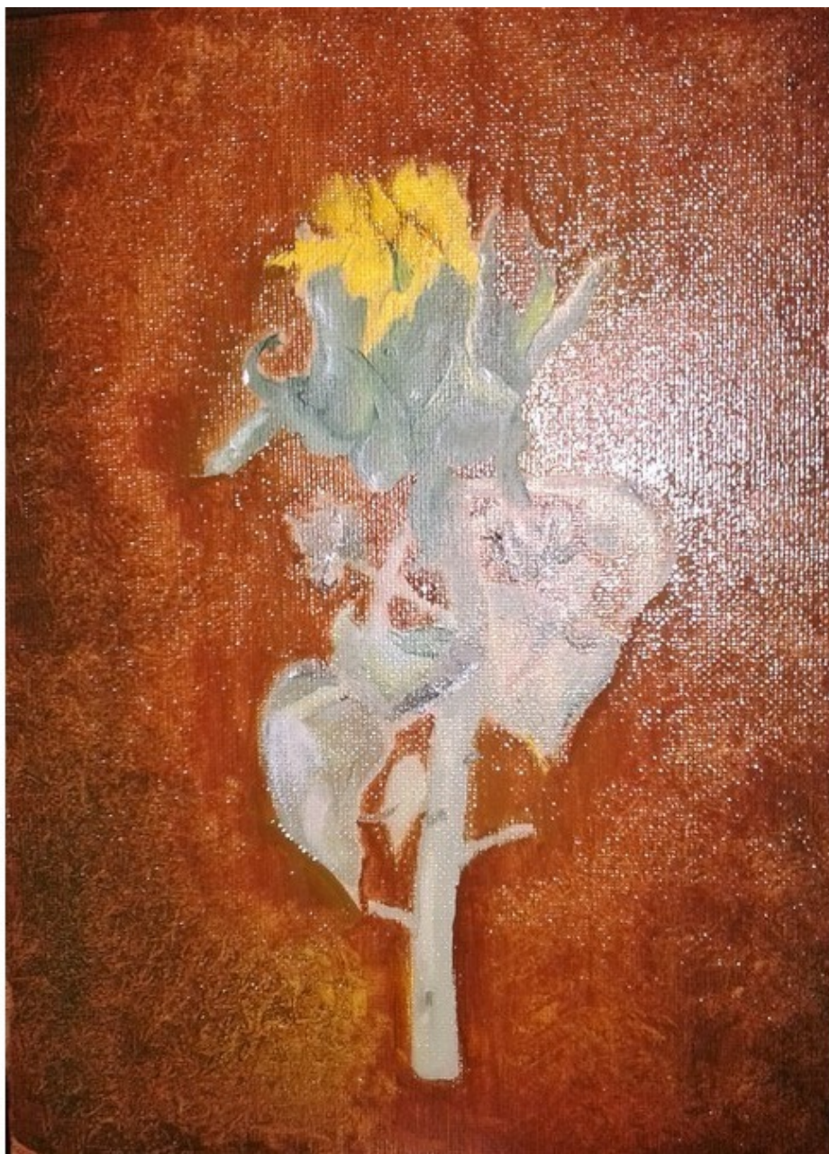
Картон 20х30, масло