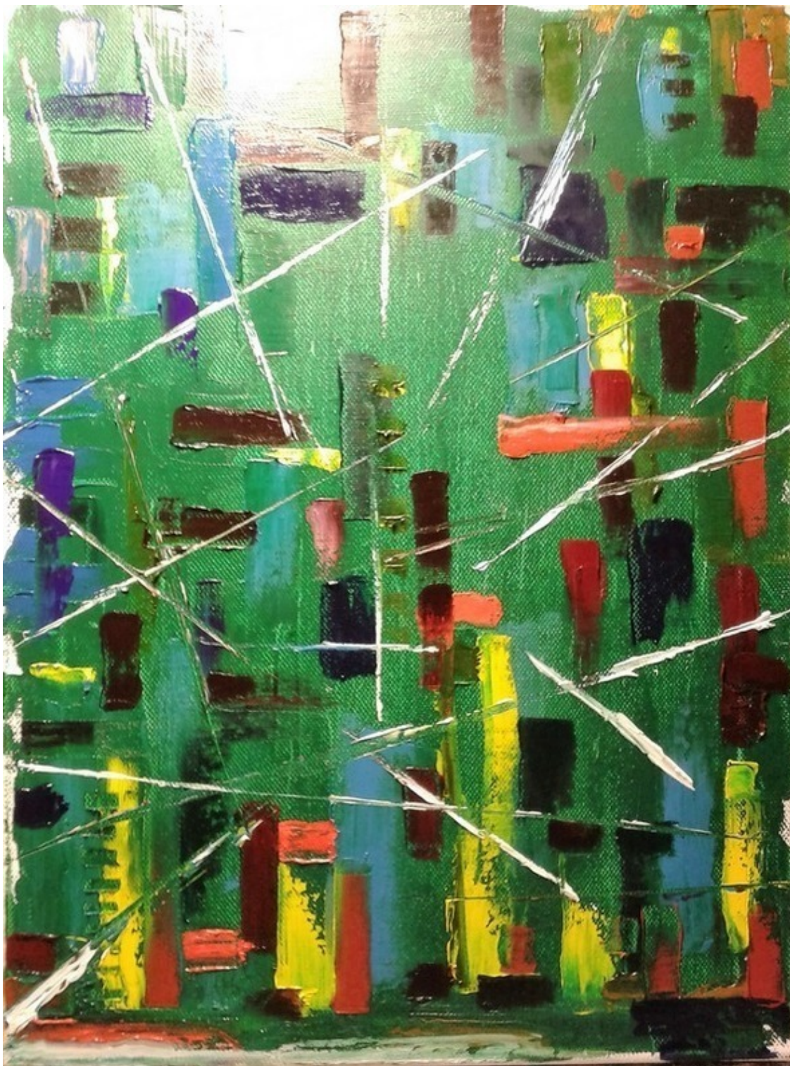
Холст 30x40, масло, мастихин