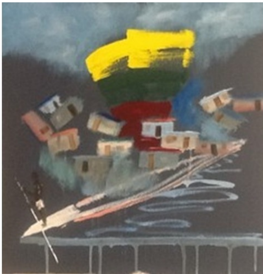
Картон 40x40, масло