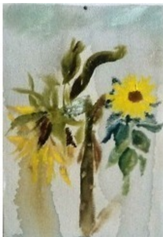
Картон 20х30, масло