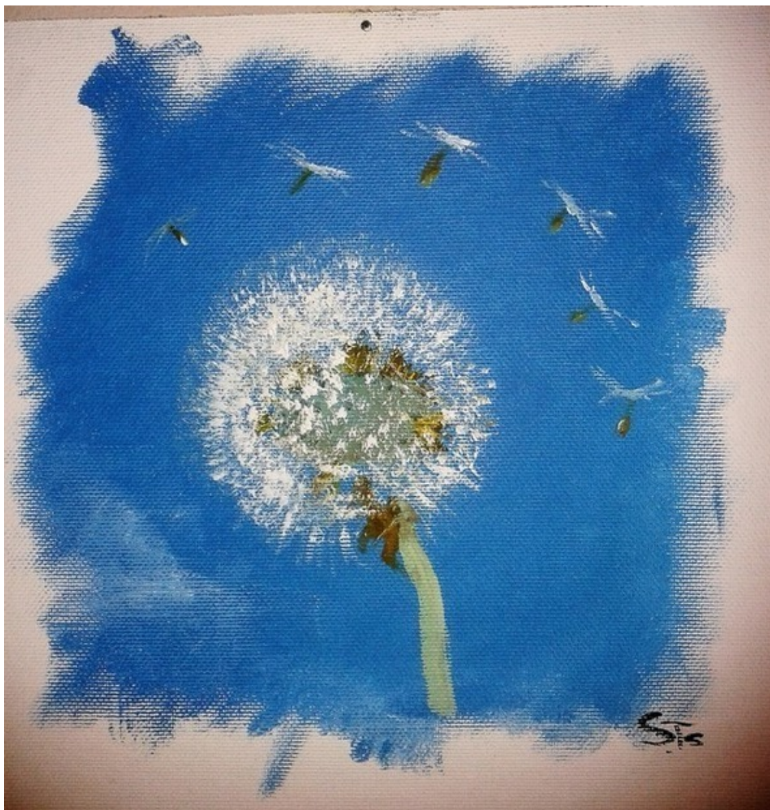
Картон, 20x20 масло