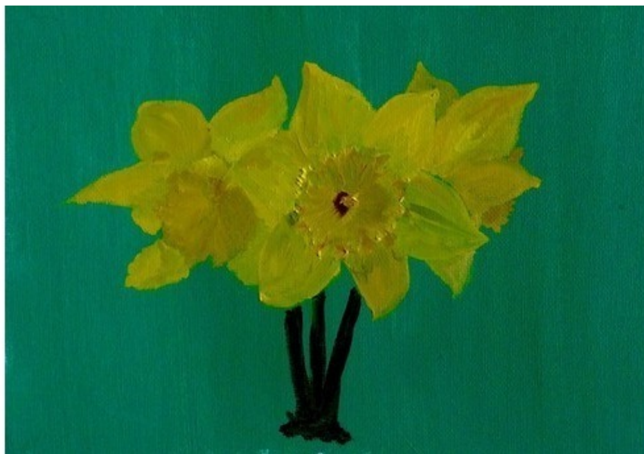
Картон 20х30, масло