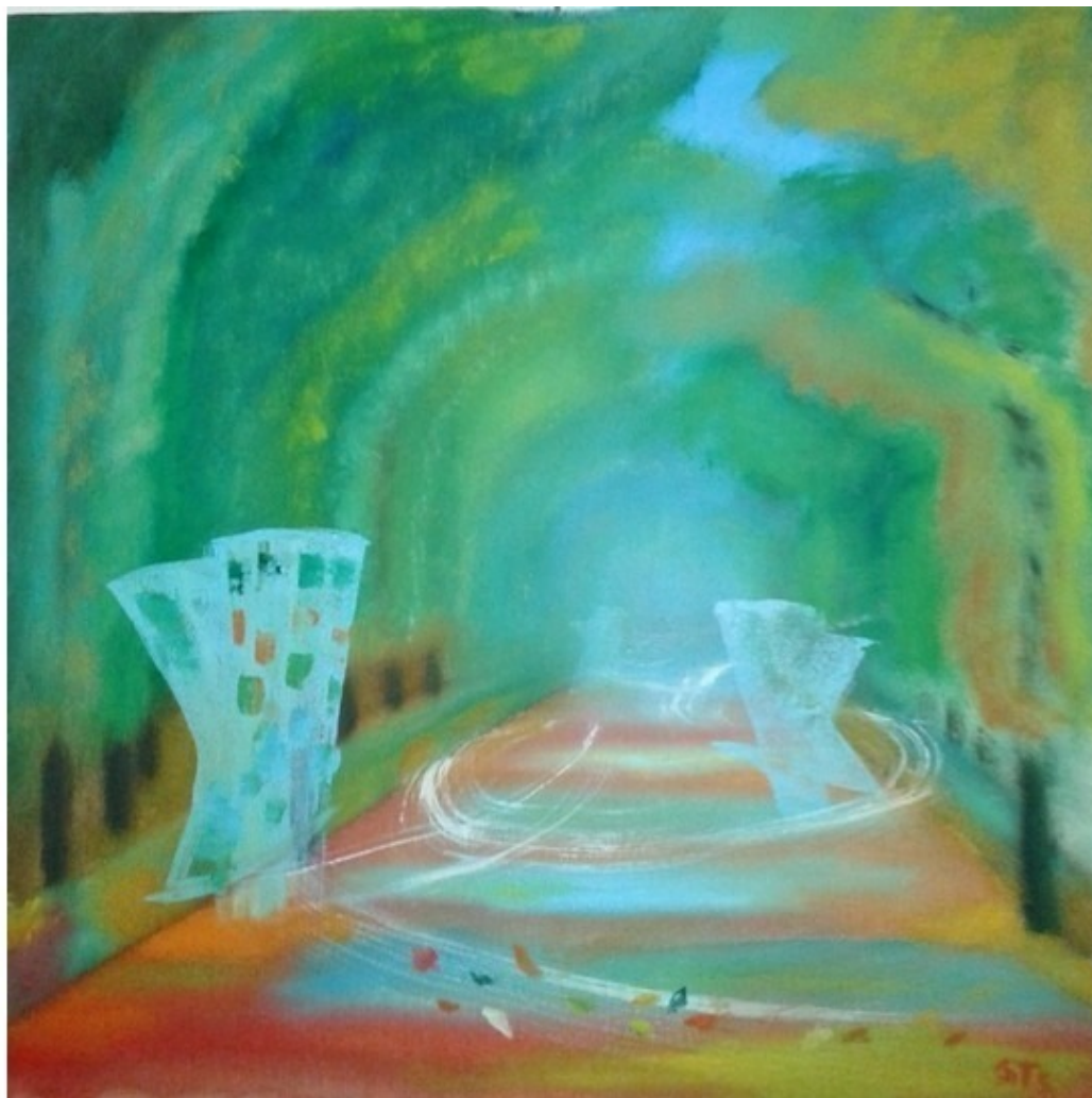
Картон 40x40, масло