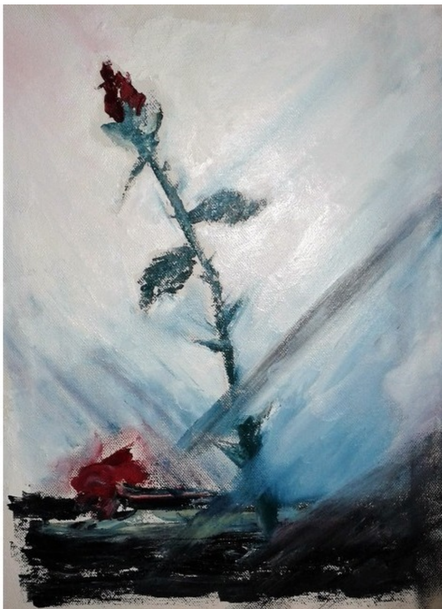
Холст 30x40, масло