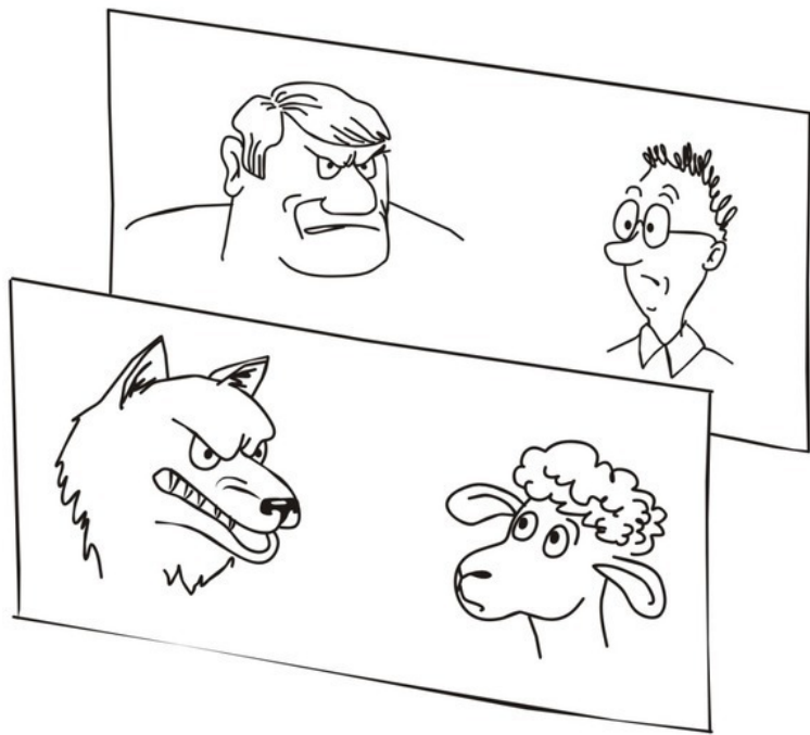
Рис. 2. Параллельные планы.

Проиллюстрируем эту разницу на примере басни «Волк и Ягненок». Очевидно, что диалог персонажей развивается одновременно в двух сюжетных планах: один – «натуральный», с естественным трагизмом подобной встречи животных в природе, другой – переносный, т.е. переносящий сюжет в контекст юридических препирательств «сильного» с «бессильным». «Параллельное» сосуществование обоих