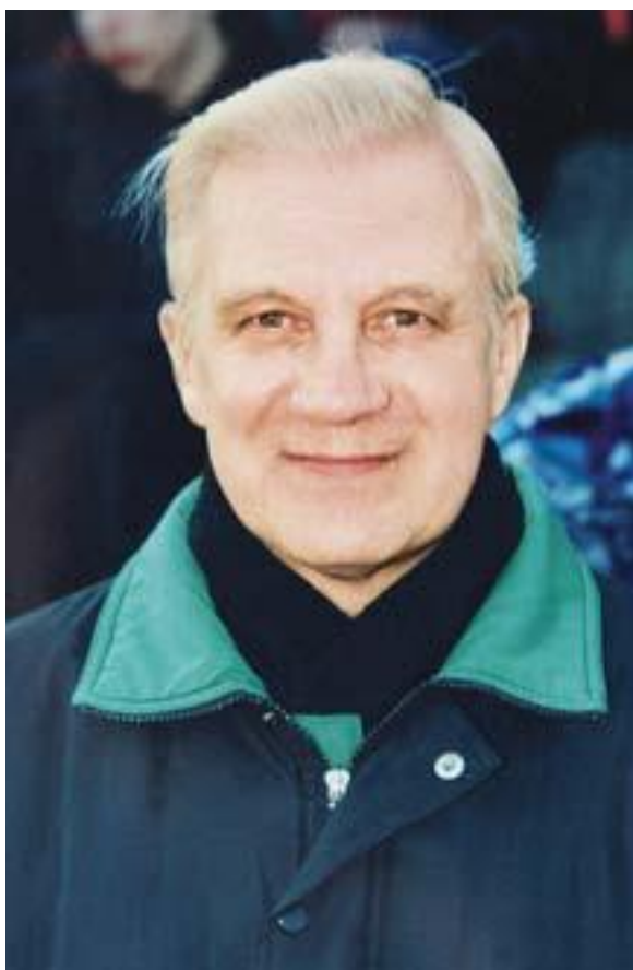
В. А. Гусев – спортивный комментатор, президент ФК «Зенит» в 1990–1992 гг.