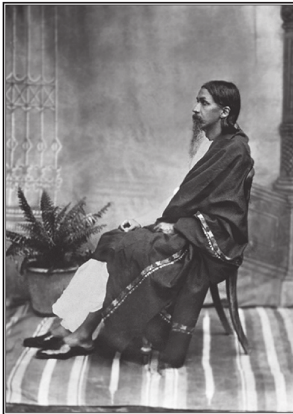
Шри Ауробиндо, Пондичери, 1915—1918 г.

Всю свою жизнь Шри Ауробиндо посвятил утверждению в нашем мире этого супраментального сознания, реализация которого должна привести к созданию на земле мира истины, гармонии и справедливости, предвещенного пророками всех времен и народов.