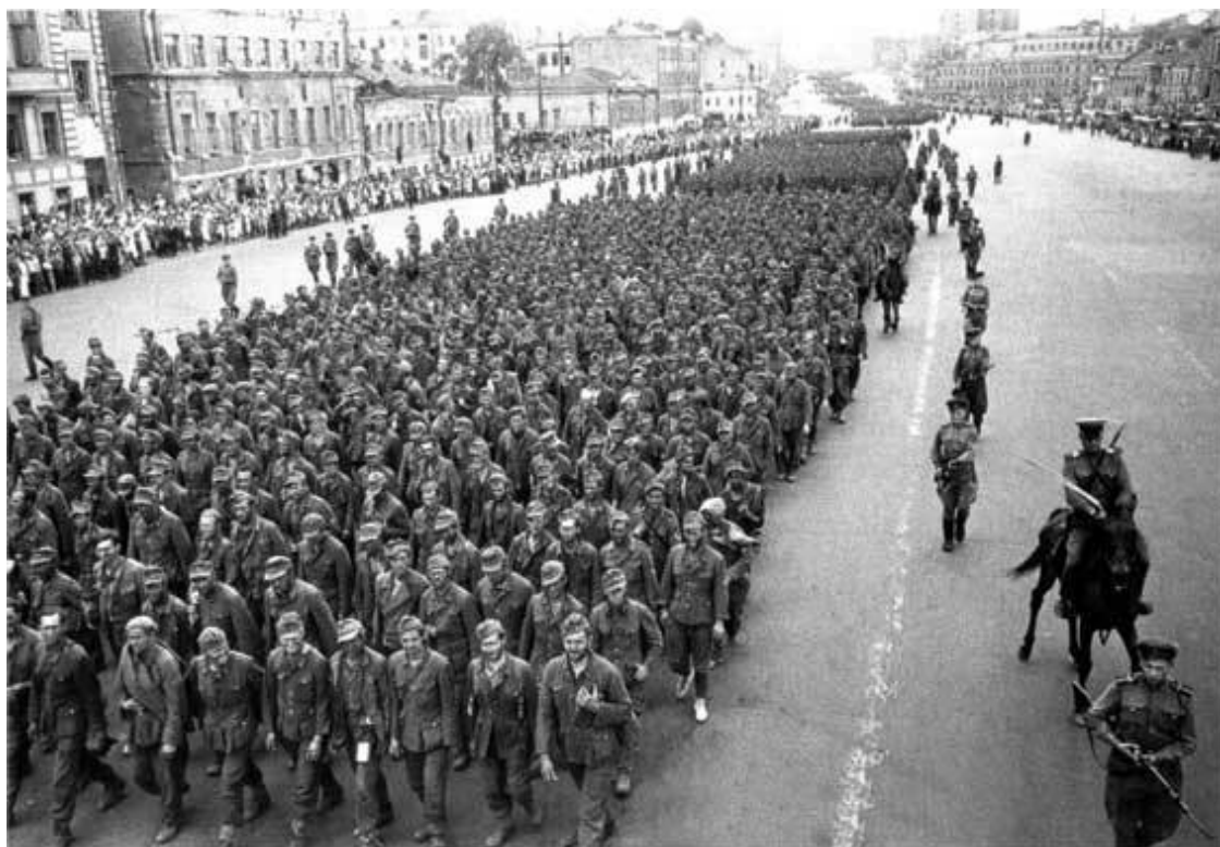
Марш пленных немцев. Москва. 1944 г.