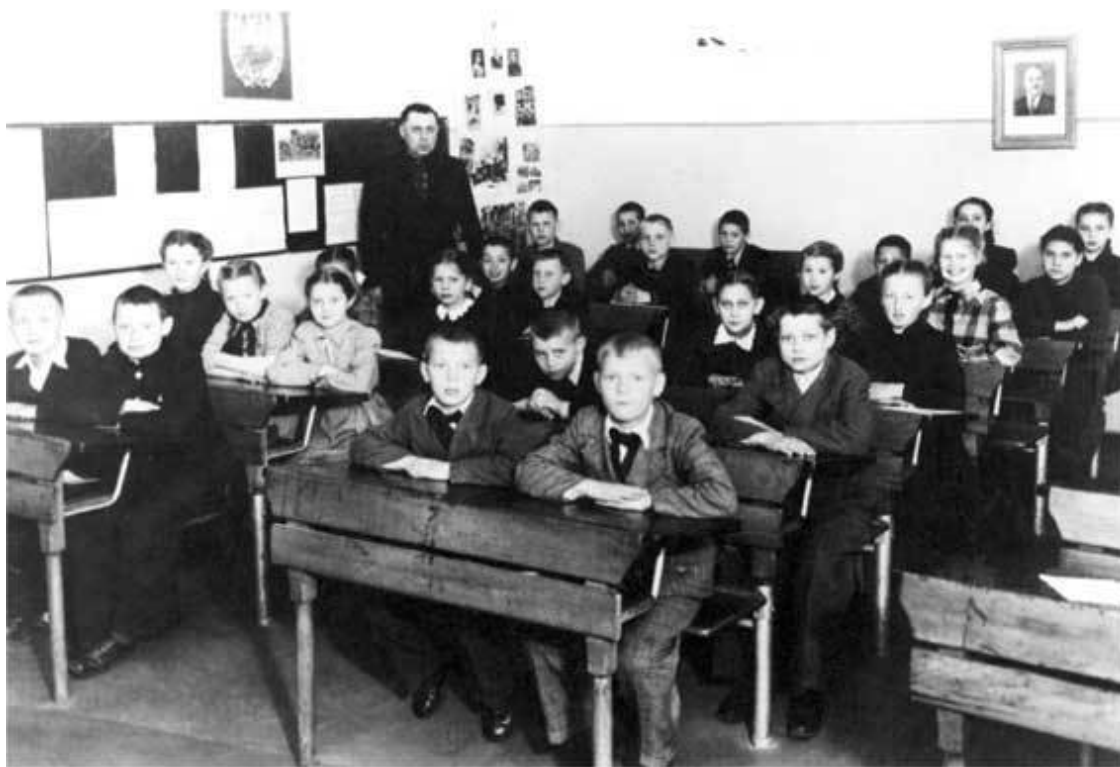
Владимир Высоцкий в 3 классе в школе г. Эберсвальде. Германия. 1947 г.

Дети быстро привыкают к ласковому обращению. Володя не был исключением. Сердце ребенка растаяло в лучах доброты своей мачехи, которую он стал считать своей второй матерью. Благодаря общительности он быстро освоился в школьном коллективе, приобрел друзей, с которыми проводил свободное от занятий время.