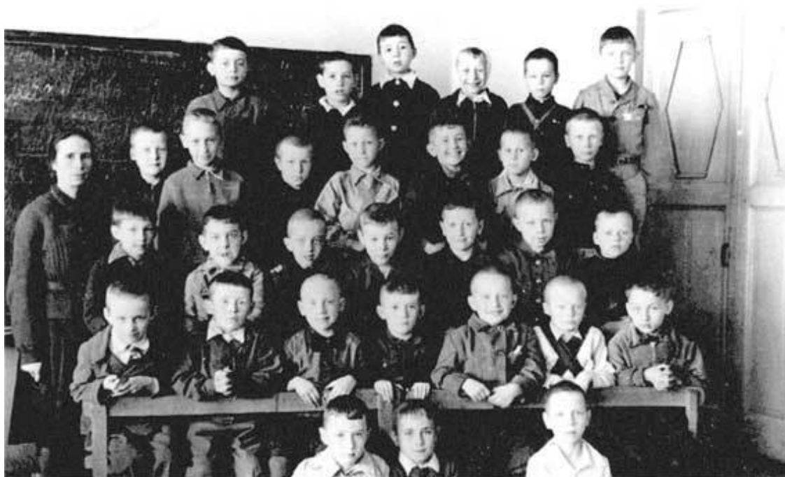
Школьный групповой снимок. Май 1946 г. Москва, Школа №73, 13 мая 1946 года, 2-й Б класс.