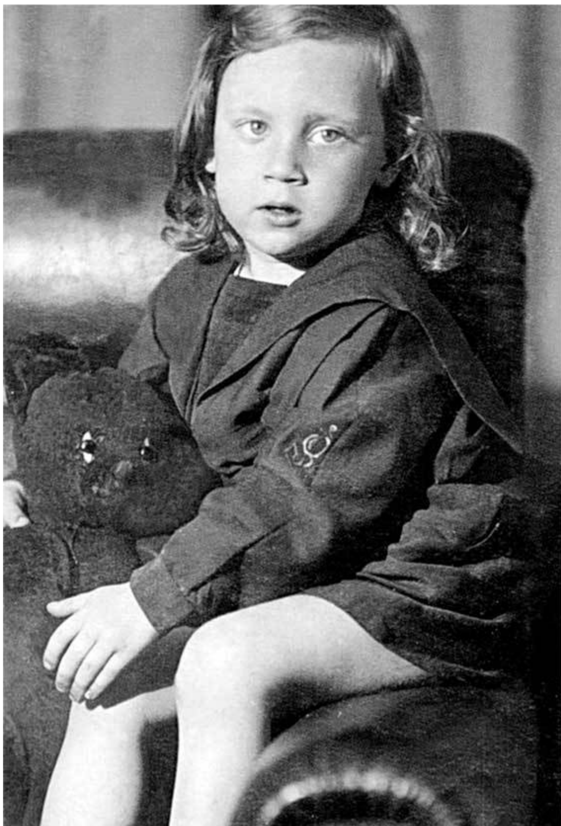
Владимир Высоцкий в детстве. 1940-е гг. Москва, июль 1941 г.

Москва в начале войны напоминала военный лагерь. По улицам днем и ночью патрулировали вооруженные солдаты. Транспорт работал с перебоями. В небе над городом висели дирижабли. Многие административные здания и памятники архитектуры были замаскированы.