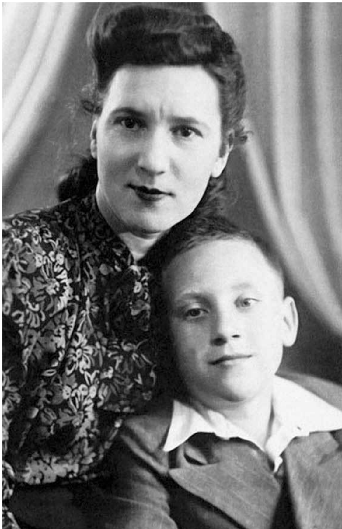
Владимир Высоцкий с матерью. 1940-е гг. Москва, май 1950 года.