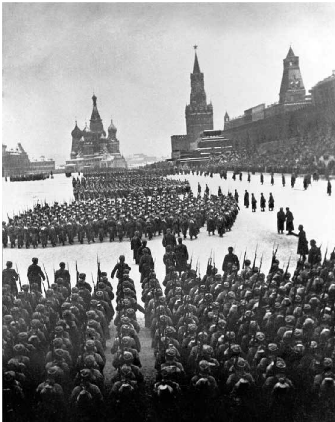
Москва в годы войны. Парад 7 ноября 1941 г.