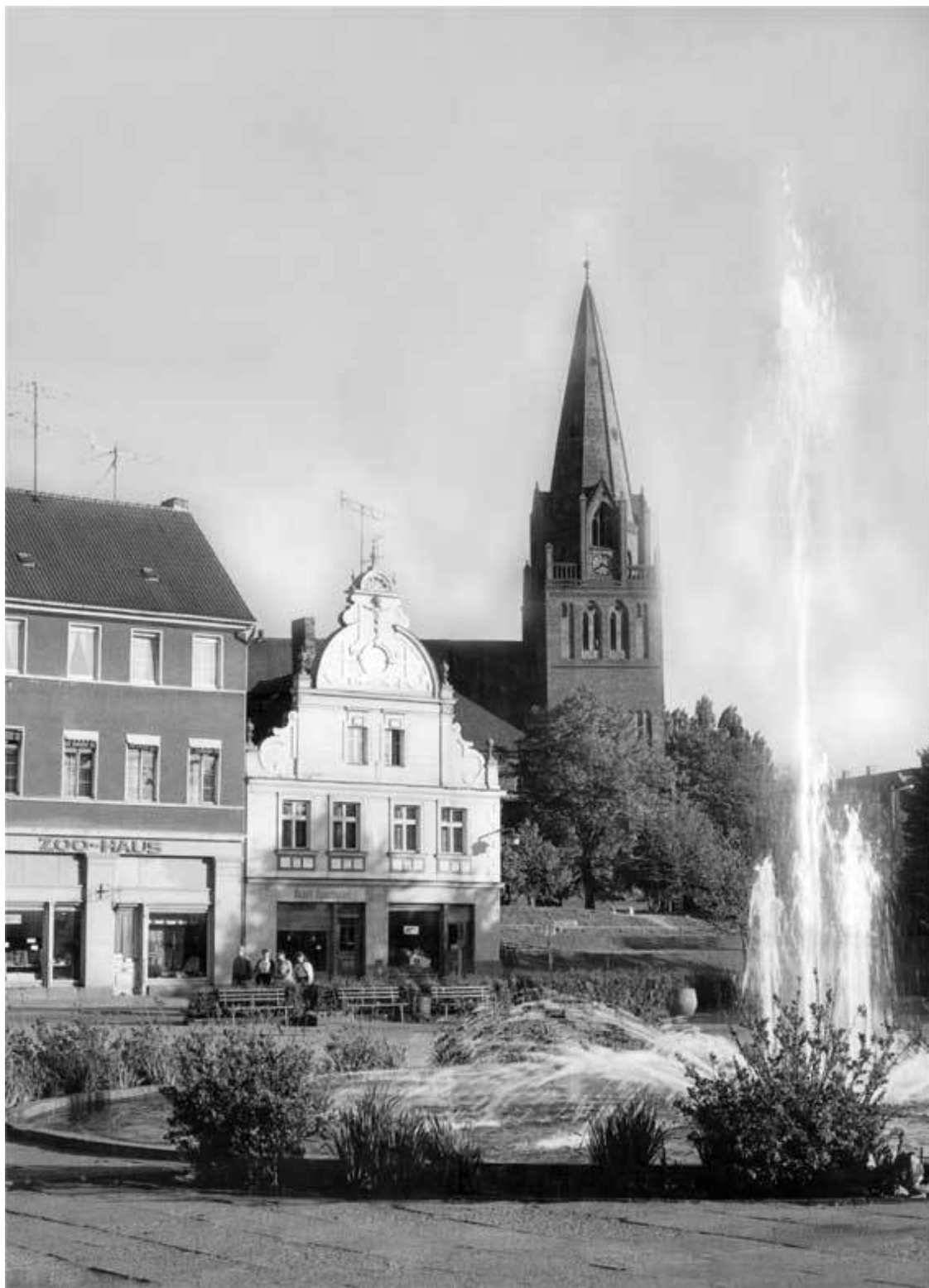
Эберсвальде в наши дни