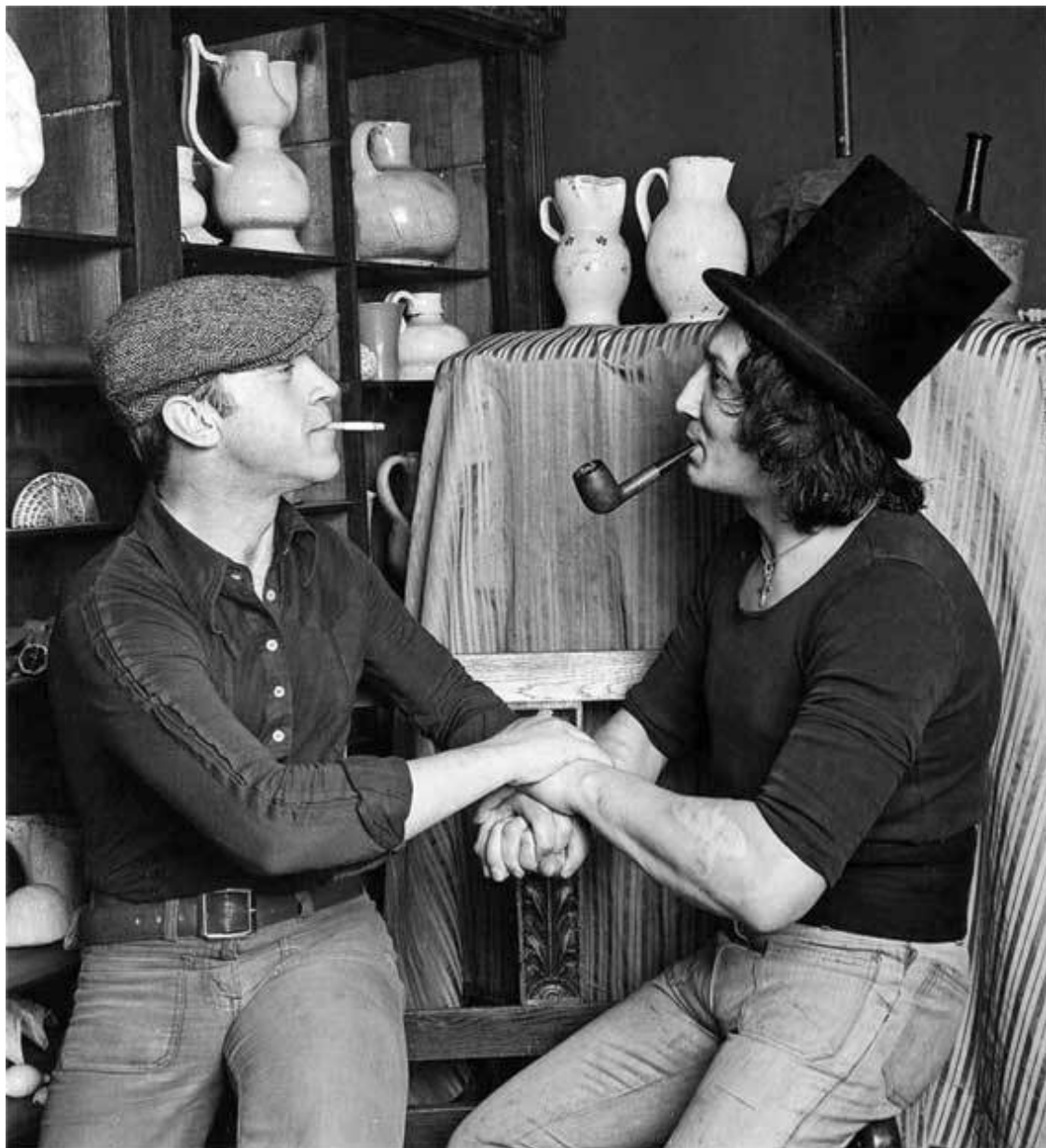
Владимир Высоцкий и Михаил Шемякин. Париж, мастерская М. Шемякина, август 1978 года.

Не имея никаких титулов, наград, званий «народного» или «заслуженного» артиста, Высоцкий сумел завоевать сердца своих соотечественников силой своего творчества. Награды и звания он получил только после своей смерти, так и не узнав о них. Этот неразгаданный до конца «феномен» Высоцкого еще долгое время будет привлекать внимание психологов, психиатров, писателей и философов.