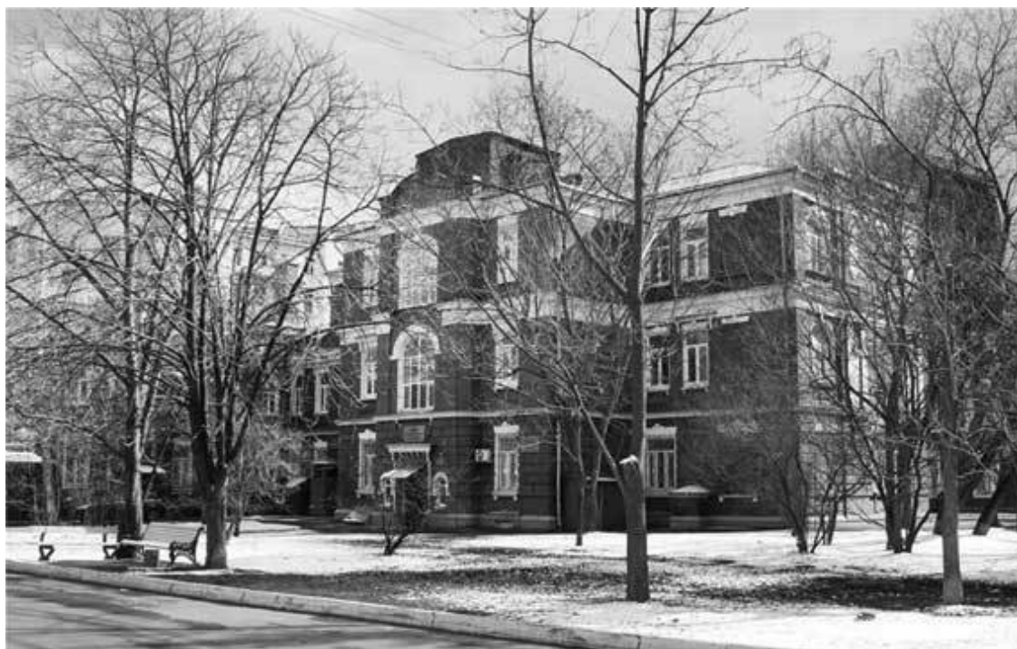
Дом, в котором родился Владимир Высоцкий