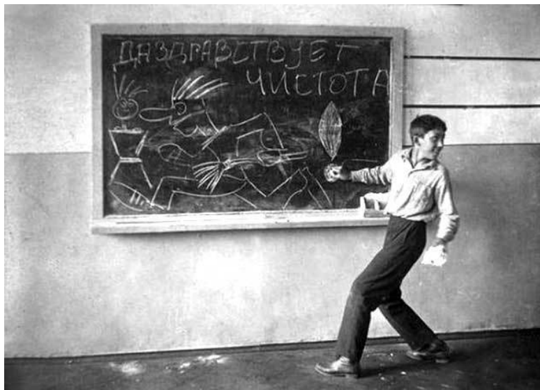
Юра Никулин в школе