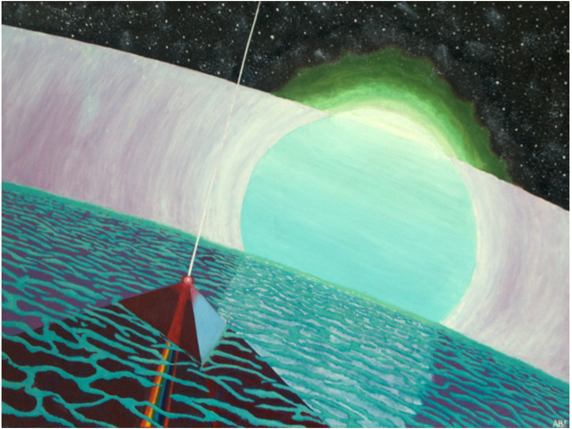
Б-г навещал Авраама в его шатре