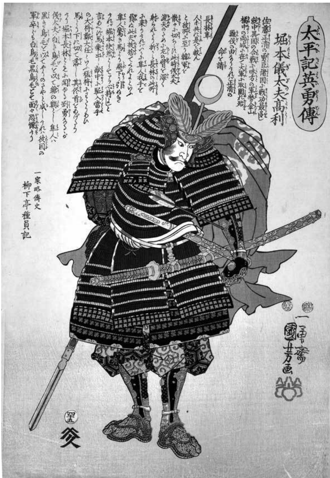
Утагава Куниёси. Воин в соломенном дождевике. 1848