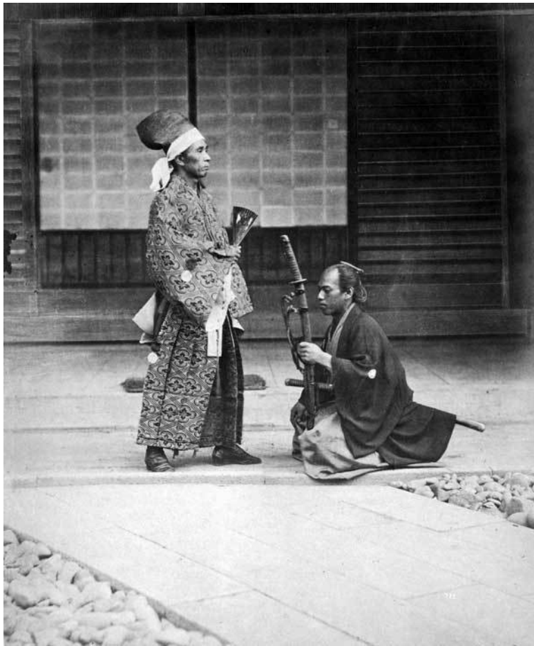
Самурай на коленях перед государственным чиновником или дайме. Фотография. 1877