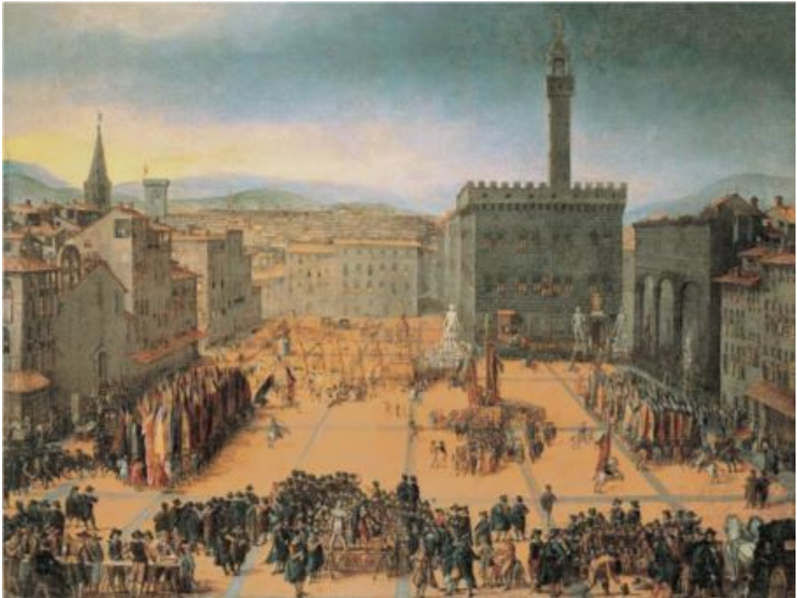
Далекая Флоренция. Площадь Синьории

Вероятно, отец Данте был юристом. В семье, ведущей свое начало от рыцарского рода, феодальные настроения были чрезвычайно сильны, хотя долгое пребывание в городе купцов и политиков, художников и поэтов заставляло эти традиции тускнеть. Понятно, что могла дать Данте школа этой эпохи – схоластика царила еще долго... Университета во Флоренции не было, и по всей вероятности, юноша учился в Болонье, университет которой славился медицинским и юридическим факультетами. Самообразование – он читал все, что попадает в поле зрения, ища свой путь, путь ученого, мыслителя и поэта. Великий римлянин Вергилий станет его «вождем, господином и учителем». Данте, овладевший французским и провансальским языками, стал поглощать поэмы о Трое и Фивах, об Александре Македонском и Цезаре, о Карле Великом и его паладинах, а в рифмованных французских энциклопедиях и дидактических поэмах он находит все новые и новые знания. Видимо, в Болонье Данте знакомится с Гвидо Гвиницелли, 1 поэтом, считавшимся родоначальником «нового сладостного стиля» (позже, в своей «Комедии» Данте назовет его отцом).