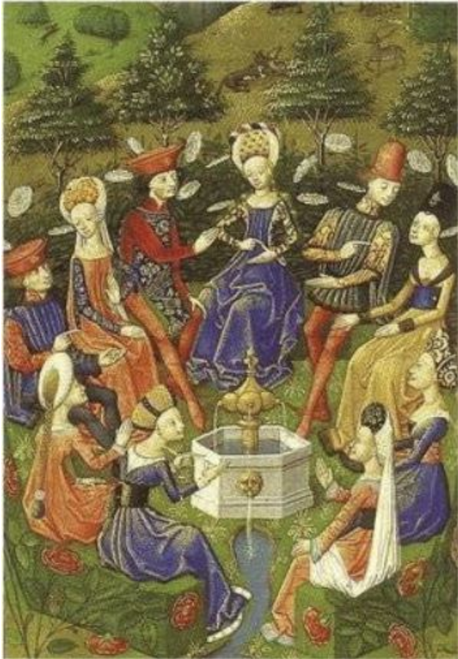
Еще одна чудесная средневековая иллюстрация к книге Боккаччо

«Декамерон» содержит десять тематических блоков – десять дней рассказов троих молодых людей и семи девушек, собравшихся в тосканском имении одного из героев, чтоб спастись от чумы – и лучшего развлечения, чем пение и танцы, любовь и игры, купание и прогулки, а, главное, увлекательные, поучительные, фривольные, таинственные истории, они не нашли! Время Боккаччо еще не знало сказок «Тысячи и одной ночи», но как похожи новеллы с обрамляющими конструкциями, новеллы, где внутри одной содержатся другие, на прекрасные сказки мастерицы Шехерезады!