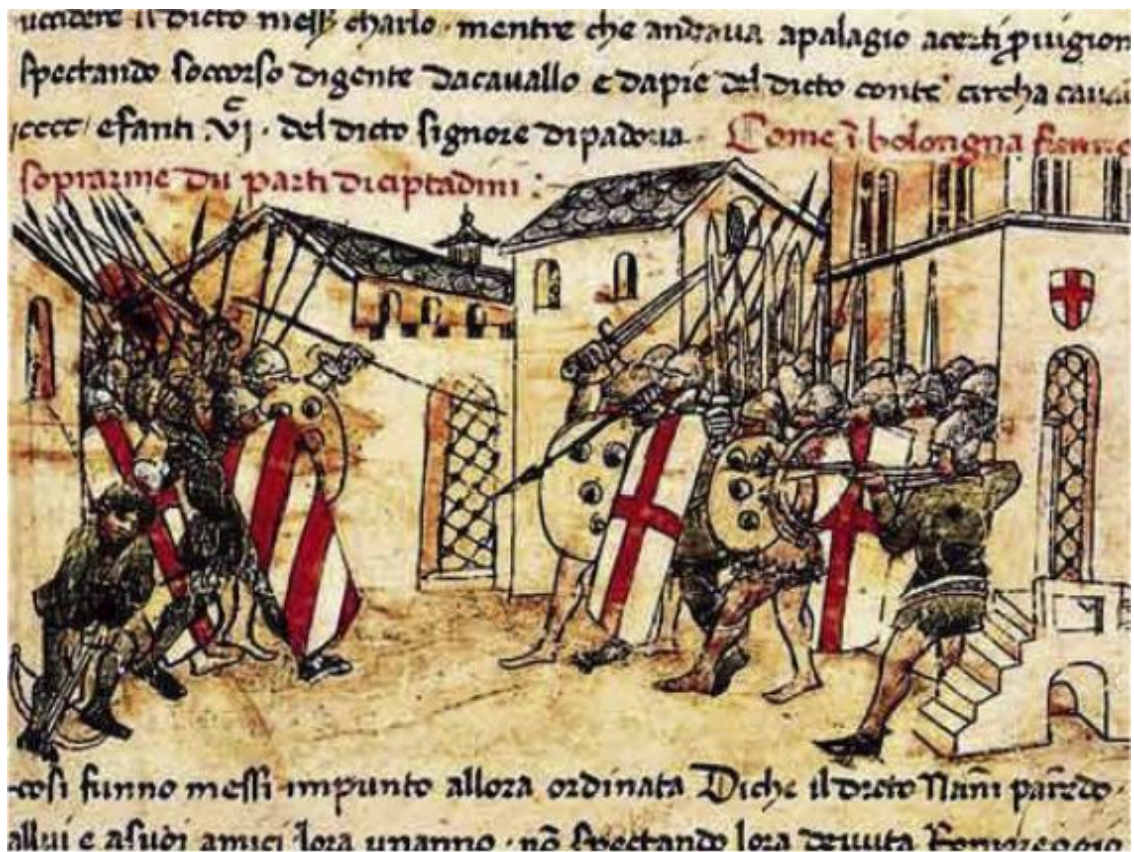
Бой между гвельфами и гибеллинами