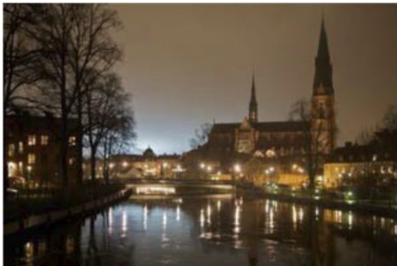
Вид на чудесный город Упсала