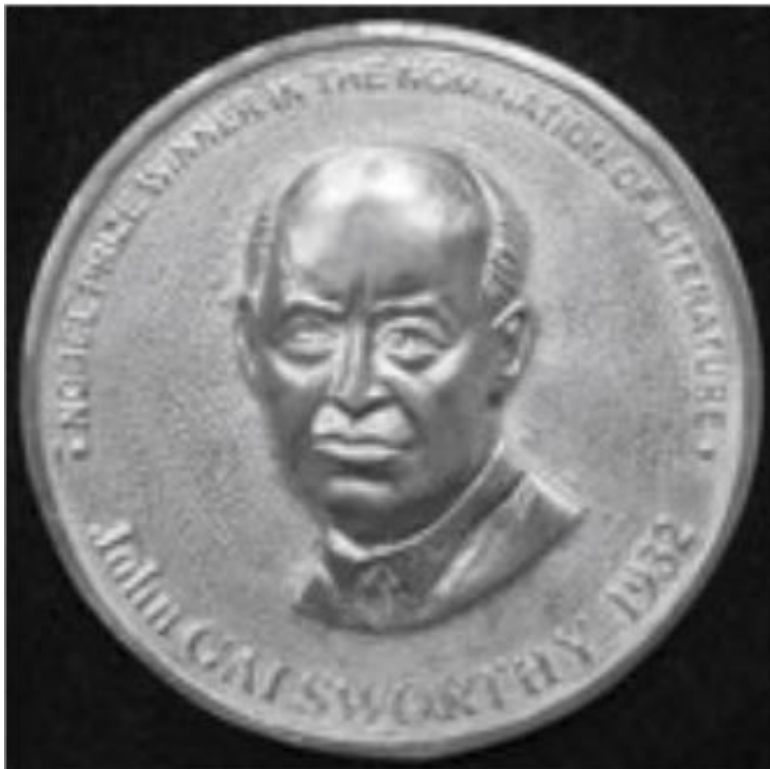
Аверс памятной медали Д.Голсуорси

После смерти Голсуорси его слава идет на убыль. Самыми непримиримыми из его критиков были Д.Г. Лоуренс и Вирджиния Вулф. Критикуя Голсуорси и его современника Г. Уэллса в пропаганде, Вулф писала: «Чтобы их романы закончились, герою нужно что-то сделать – вступить в какое-то об-