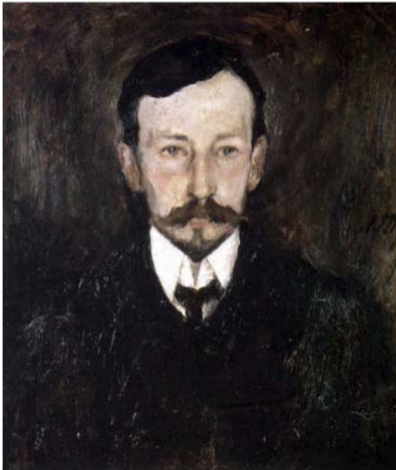
Портрет И.Бунина работы Л.Туржанского. 1905 год

В первые годы XX века Бунин активно занимается пе-