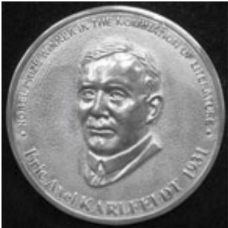
Аверс памятной медали Э.Карлфельдта

Особенно активно ратовал за присуждение премии Н.Се-дерблум, член Шведской академии и архиепископ Упсалы. Решение академии вызвало широкое недовольство в Скандинавии да и во всем мире, в связи с чем пришлось на-помнить, что, согласно правилам присуждения Нобелевской