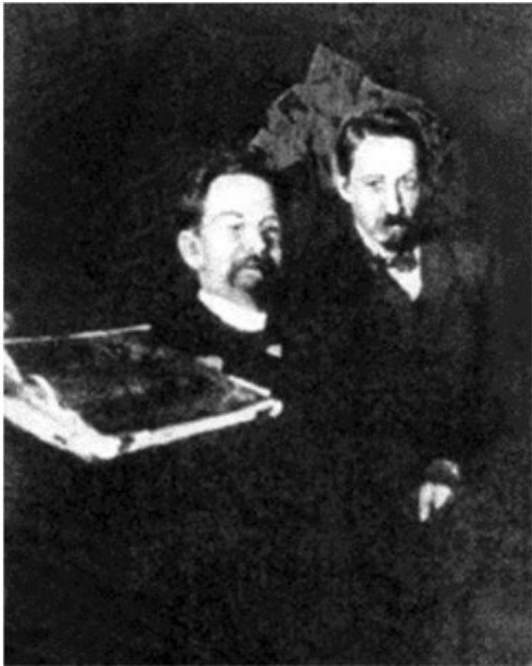
И.Бунин и А.Чехов. 1900 год