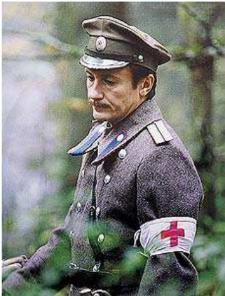
О.Меньшиков в главной роли в фильме А.Прошкина