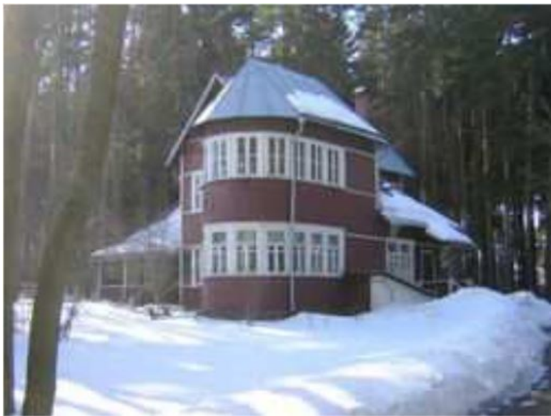
Дом-музей Б.Л.Пастернака в Переделкино

– Ага, вот-вот. Ты нагнись, я на ухо. Надо взять, вымочить в сале, сало пристанет, наглотается он, паршивый пес, набьет, сатана, пестерь, и – шабаши! Кверху лапки! Стекло!