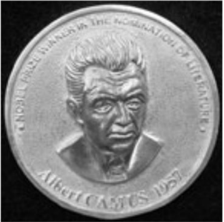
Памятная Нобелевская медаль А.Камю

Жан-Батист Кламанс признается в своих преступлениях против морали. Обращаясь к теме вины и раскаяния, Камю в «Падении» широко пользуется христианской символикой.