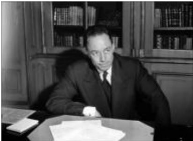
А.Камю в 40-х годы