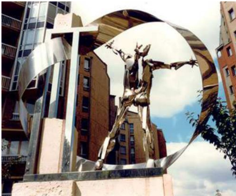
Памятник А.Камю в Париже на улице Альбера Камю

По мнению американской исследовательницы и замечательной, известной писательницы Сюзан Зонтаг, «проза Камю посвящена не столько его героям, сколько проблемам вины и невиновности, ответственности и нигилистического безразличия». Полагая, что творчество Камю не «отличается ни высоким искусством, ни глубиной мысли», Зонтаг заявляет, что «...его произведения отличаются красотой совершенно иного рода, красотой нравственной». Ряд исследова-