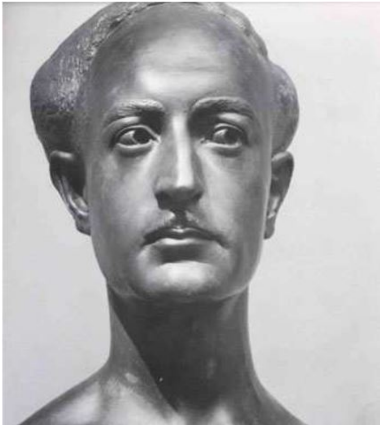
Сальваторе Квазимодо. Бюст работы Ф.Мессины

В 1945 году Квазимодо вступил в итальянскую компартию, однако вскоре вышел из ее рядов, когда от него потре-