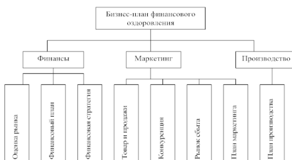
Рис. 2. Структура бизнес-плана финансового оздоровления организации

Основным сводным документом финансового оздоровления является бизнес-план, в котором показывается каким образом руководство намерено преодолеть кризисную ситуацию, намечаются конкретные пути предотвращения банкротства. В общем виде структуру бизнес-плана финансового оздоровления можно представить в виде схемы (рис. 2).