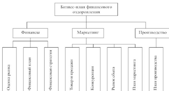
Рис. 2. Структура бизнес-плана финансового оздоровления организации

ротства. В общем виде структуру бизнес-плана финансового оздоровления можно представить в виде схемы (рис. 2).