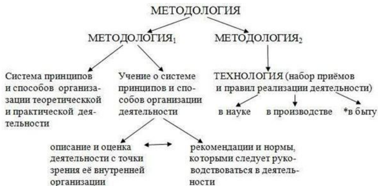
Рис. 1.1. Значения слова «методология»

Обратим внимание на то, что знак «*», сопровождающий направление использования обсуждаемого термина «в быту», т.е. в качестве популярного слова, утратившего свое первоначальное значение, указывает на неоправданное расширение значения слова «методология» (вспомним пример с «методологией решения кроссворда», где на самом деле речь идёт о предпочитаемой последовательности действий, которую правильнее называть « стратегией решения задачи»).