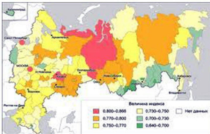
Рис. 7.4. Индекс развития человеческого потенциал субъектов РФ (2009 г.)

В Концепции национальной безопасности РФ вполне определенно сформулированы реальные угрозы российской безопасности , к числу которых отнесены: