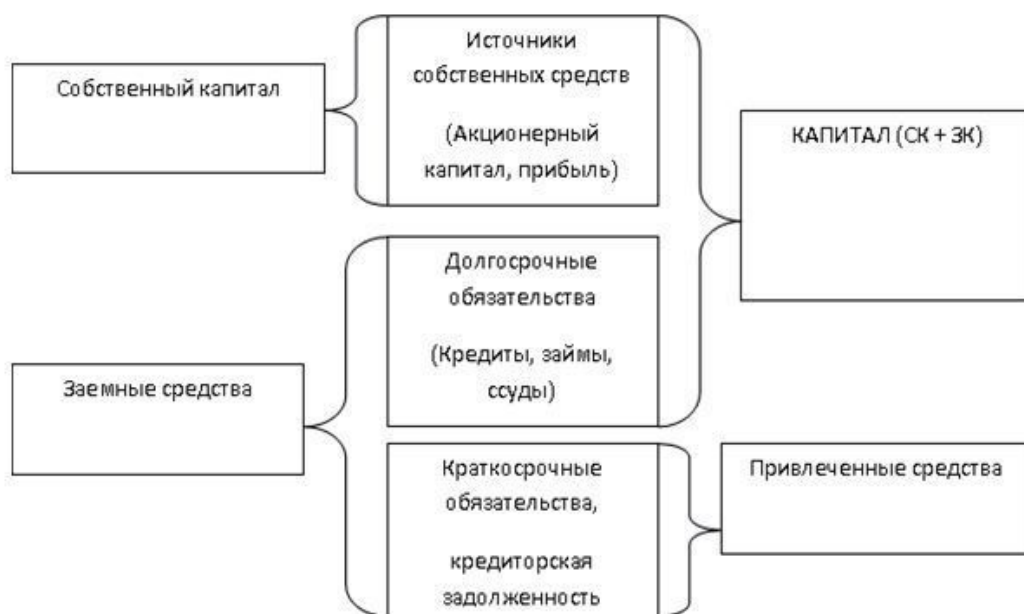
Рис. 1.2. Источники финансирования

Будем исходить из предположения, что оборотные (текущие) активы компании финансируются за счет краткосрочных источников средств (краткосрочных обязательств), а внеоборотные (постоянные) активы – за счет долгосрочных.