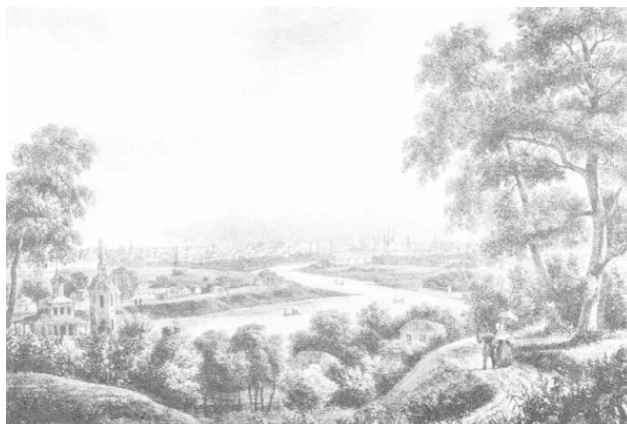
Москва.1825 год. Вид с Воробьёвых гор. Художник С. Кадель.