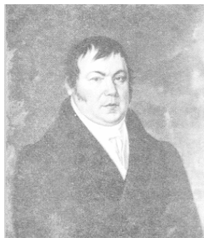
Петр Кононович Боткин. 20- е годы 19 века. Русский художник.

мьи Боткиных с ученым и литературным миром еще более упрочилась, когда одна из дочерей Петра Кононовича вышла замуж за поэта Фета, а другая – за московского профессора Пикулина.