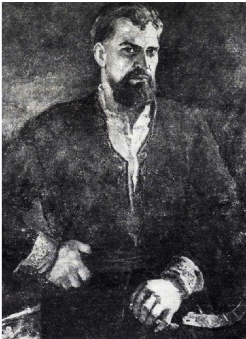
Атаман Кондратий Афанасьевич Булавин

Однако на самом деле у Булавина было уже до 20 тысяч преданных ему людей. Он намеревался уже идти на Москву. Брожение быстро пронеслось по всем городам тогдашней Южной России. Все знали, что боярам, приказным и сборщикам податей пощады не будет. В Тамбовском и Козловском уездах и близ Тулы мятежные шайки жгли деревни и принуждали жителей к восстанию.