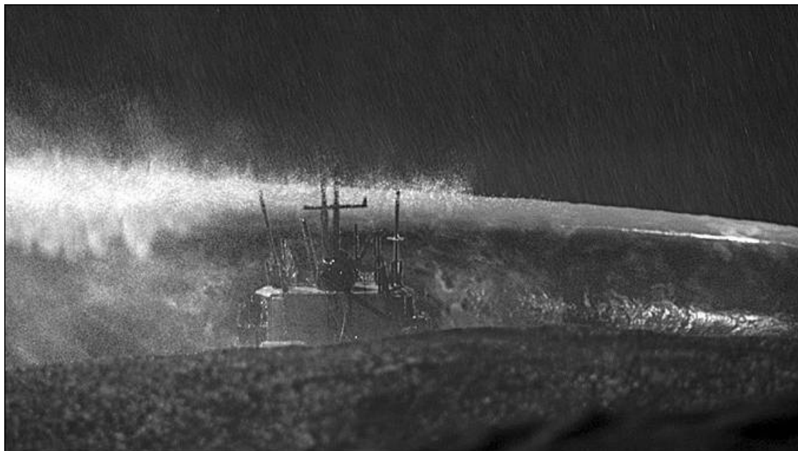
Волны-убийцы стали причиной гибели многих кораблей

В 1980 году у берегов Японии затонул английский сухогруз «Дербишир». Погибли 44 человека. Как показало расследование, причиной гибели 300-метрового гиганта стала огромная волна, пробившая главный грузовой люк и мгновенно залившая трюм.