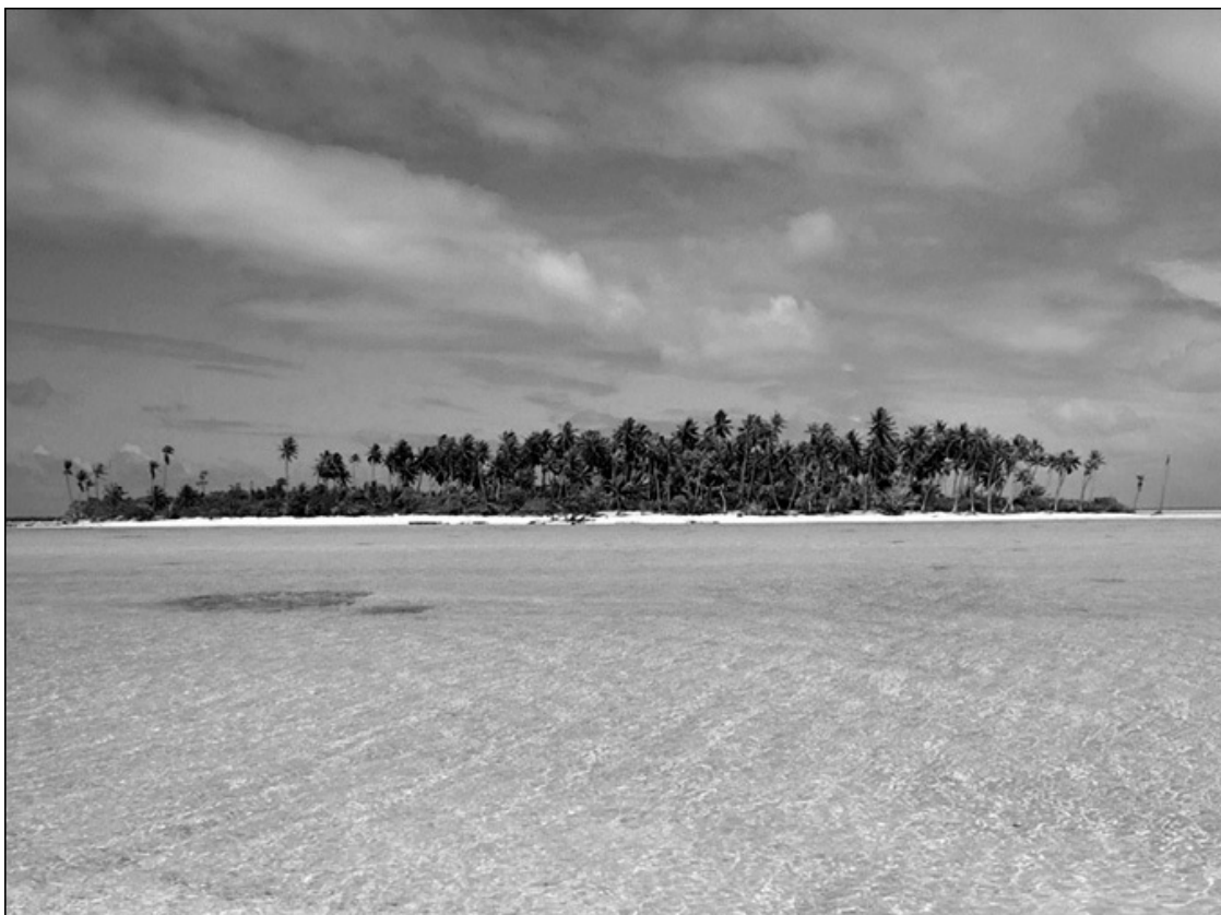
У берегов Таити

Долгое время исследователи не могли объяснить сути загадочных приливов у островов Таити в Тихом океане. Даже еще совсем недавно некоторые географы, описывая эти острова, утверждали, что у берегов Таити приливы наступают всегда в один и тот же час: полная вода – в полдень и в полночь, малая вода – в 6 часов утра и в 6 часов вечера. А некоторые наблюдатели при этом добавляли, что на Таити океан не повинует Луне, а признает только Солнце.