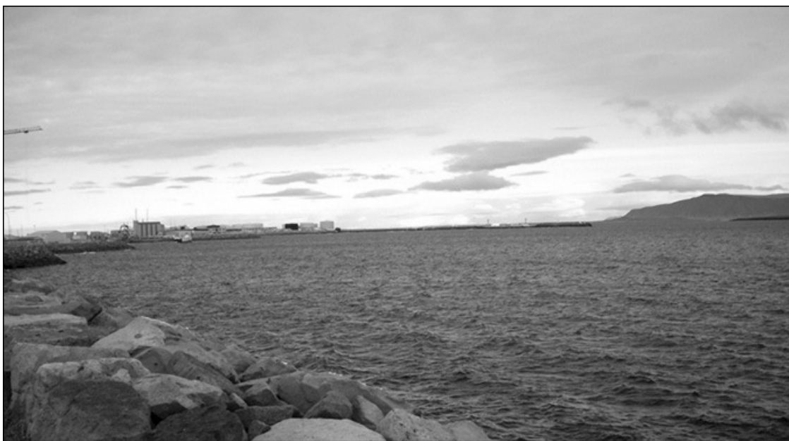
В Датском проливе находится один из самых больших подводных водопадов

Движущей силой большинства из них является различие в температурах океанских бассейнов. Тяжелая, холодная вода у Северного и Южного полюсов стекает ко дну, где далее движется в соответствии с его рельефом. Стекая по склону все глубже и глубже, эта река, переваливаясь через водораздельный «подоконник», ввергается в соседний океанский бассейн.