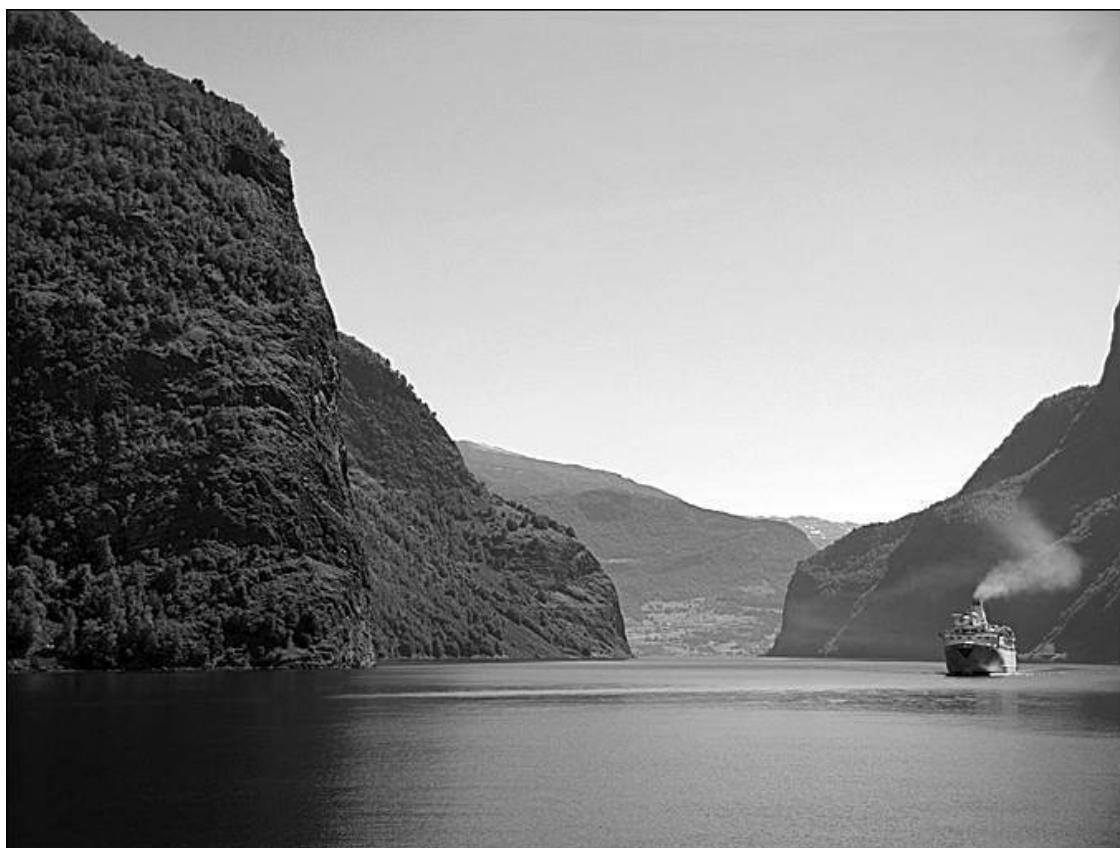
В скандинавских фьордах суда часто сталкиваются с эффектом «мертвой воды»