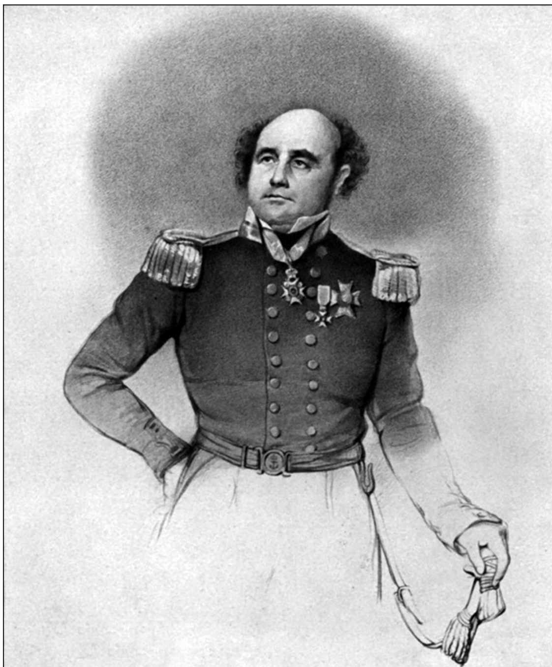
Джон Франклин – знаменитый английский мореплаватель, в середине XVIII века сделавший первый шаг на подступах к изучению внутренних волн

Более же серьезно внутренние волны стали изучать только после Второй мировой войны. И в ходе научных исследований почти сразу же удалось выяснить любопытнейшие подробности этого феномена. Например, что даже при полном штиле на глубине в 200–300 метров могут «бушевать» настоящие бури и штормы, а подводные волны – достигать весьма внушительных размеров. В частности, амплитуда их высоты может составлять иной раз 50 метров, а ширины – более 100 метров. Период же колебаний способен держаться в интервале от нескольких минут до нескольких суток.