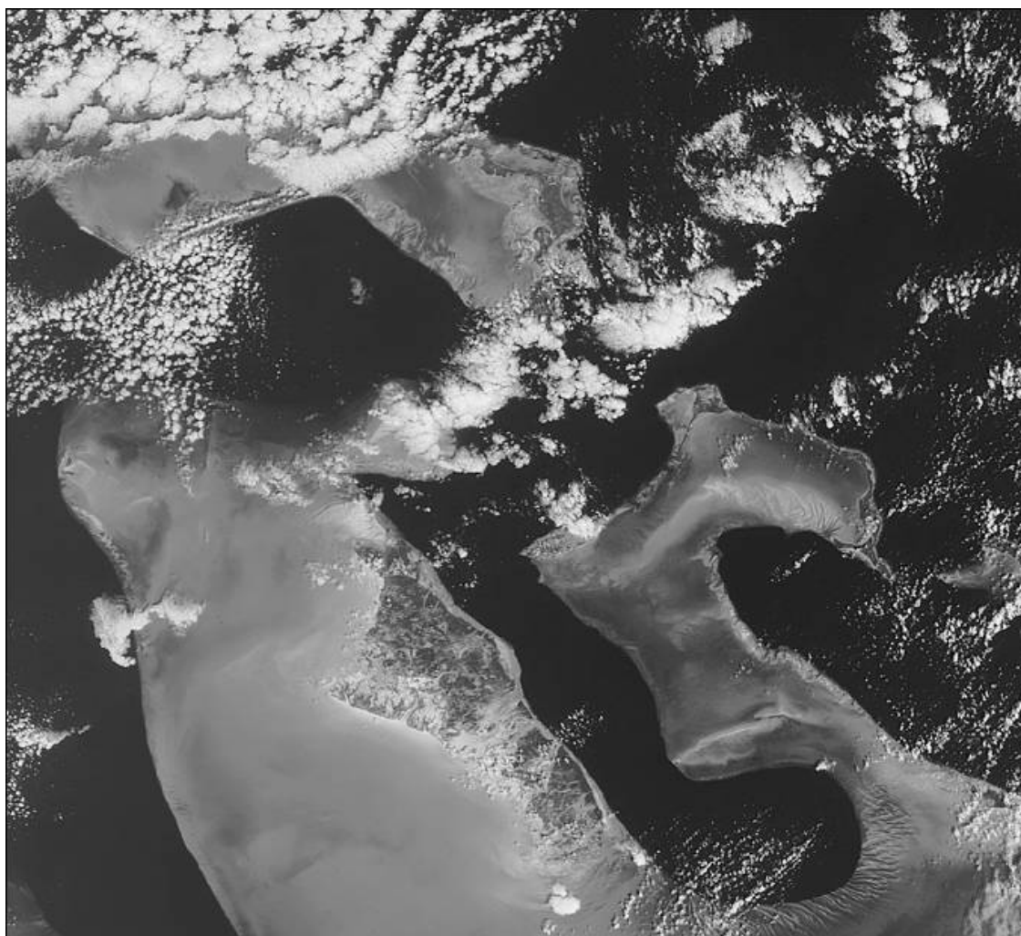
Багамские острова. Вид из космоса

Можно предположить, что вариации яркости моря и цветовых оттенков в этом районе были вызваны не только изменением глубины сильно изрезанного дна, но и сложным гидрологическим режимом, который зависит как от рельефа дна, так и от особенностей вертикальных и горизонтальных течений, а также от наличия планктона и ряда других взаимосвязанных факторов.