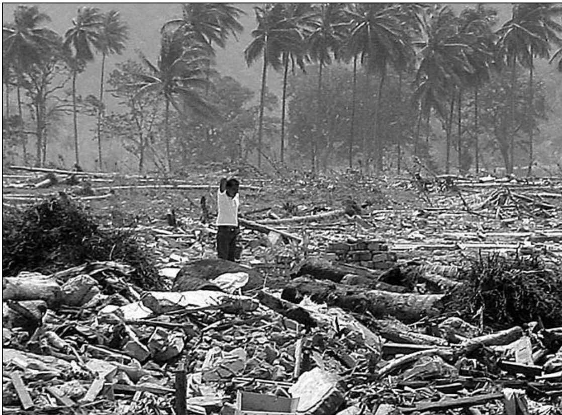
Последствия цунами в Индонезии. 2004 г.

26 декабря 2004 года у берегов Индонезии произошла крупнейшая из постигших человечество за последние 100 лет природная катастрофа. По крайней мере, общее число погибших в той катастрофе составило, по разным оценкам, более 280 тысяч человек. Помимо многочисленных жертв, она причинила и колоссальный материальный ущерб.