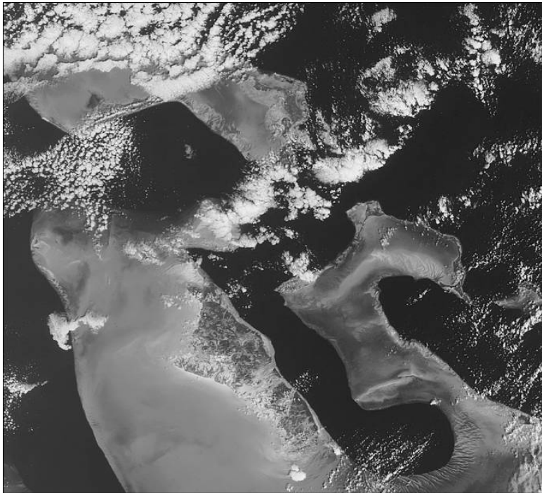
Багамские острова. Вид из космоса

Как известно, цвет моря определяется содержанием в воде растворенных и взвешенных веществ. Многие наблюдатели и исследователи Бермудского треугольника утверждают, что вода в его южной части приобретает необычный белый цвет. В частности, один из пилотов «знаменитого» американского 19-го звена, потерпевшего крушение в районе Бермуд, якобы