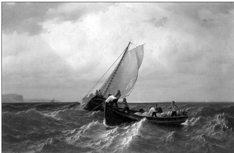
Рыбачьи лодки в заливе Фанди. Художник У. Брэдфорд

В древности же была подмечена и связь между высотой приливов и фазами Луны. Здесь первенство принадлежит уроженцу Массилии (ныне Марсель) географу Пифею, побывавшему на берегах Англии, где приливы особенно велики.