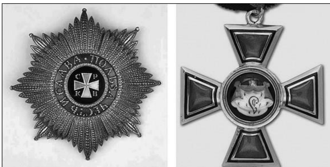
Орден Святого Равноапостольного Князя Владимира

Орден Св. Владимира предназначался для награждения как за военные, так и за гражданские заслуги. Это был первый русский орден, которым мог быть награжден обычный чиновник, не относившийся к высшим должностным лицам страны и не совершивший выдающихся подвигов на поле боя.