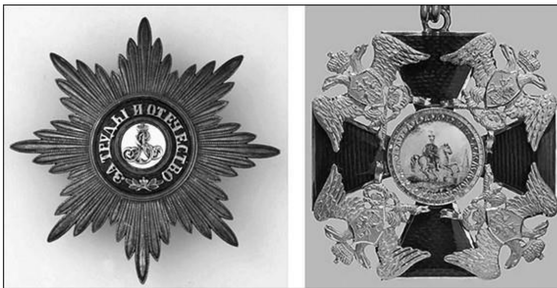
Орден Святого Благоверного Князя Александра Невского

Знак ордена представлял собой золотой крест, покрытый с обеих сторон красной эмалью (до 1816 г. – «рубиновым стеклом»). Между четырьмя концами креста размещались золотые двуглавы орлы с распушенными крыльями, «перунами» и лавровыми венками в когтях. В центре аверса был изображен Св. Александр Невский, а на реверсе – его латинский вензель SA под княжеской короной (на знаках, жалуемых лицам нехристианского вероисповедания, изображения святого с 1844 г. заменялись изображением двуглавого орла). Крест носился на шейной ленте, а в особо торжественных случаях – у бедра на наплечной ленте. Звезда ордена была серебряной, восьмиконечной, с вензелем Св. Александра Невского в центре и орденским девизом «За труды и отечество». Орденская лента красная, надевалась через левое плечо. К знаку и звезде, жалуемых за военные заслуги, с 1855 г. прилагались скрещенные мечи. В 1856 г. к ордену предполагалось ввести парадную цепь, но дальше утвержденного Александром II проекта дело не пошло. Как бы отдельную степень ордена представляли собой его алмазные знаки, которые жаловались отдельно.