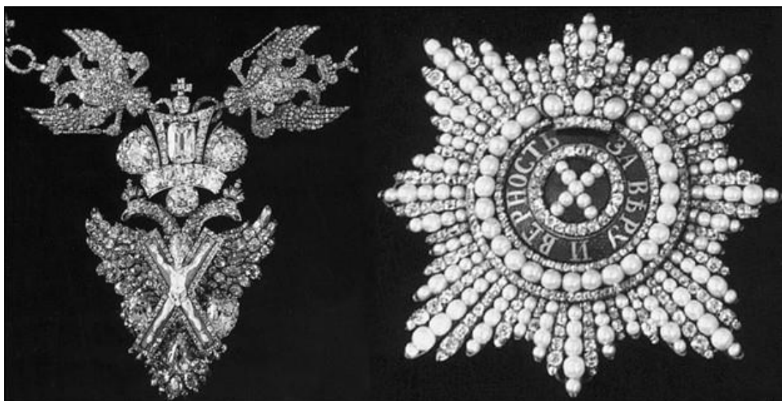
Орден Святого Апостола Андрея Первозванного

Орден был наименован в память апостола Андрея, который издавна почитался как первый проповедник христианства на Руси и ее покровитель (хотя многие историки считают рассказы о путешествии апостола в Киев и Новгород не более чем апокрифом). Так или иначе, около 70 г. в греческом городе Патры апостол был распят на косом кресте, который получил название «Андреевский». Поэтому синий Андреевский крест стал знаком нового ордена. На концах этого знака размещались буквы S.A.P.R. (Sanctus Andreus Patronus Russiae – «Святой Андрей покровитель России»). Знак надевался на муаровую голубую ленту, которая носилась через правое плечо. Орденская звезда была восьмилучевой, с девизом «За веру и верность» в центре аверса. В XVIII веке звезда ордена часто вышивалась на одежде, начиная с XIX века она выполнялась из серебра. Звезда носилась на левой стороне груди выше всех прочих наград; в том случае, если орден вручался за боевые заслуги, к знаку и звезде с 1855 г. присоединялись скрещенные мечи. Кроме того, в торжественных случаях знак ордена носился на груди на фигурной цепи.