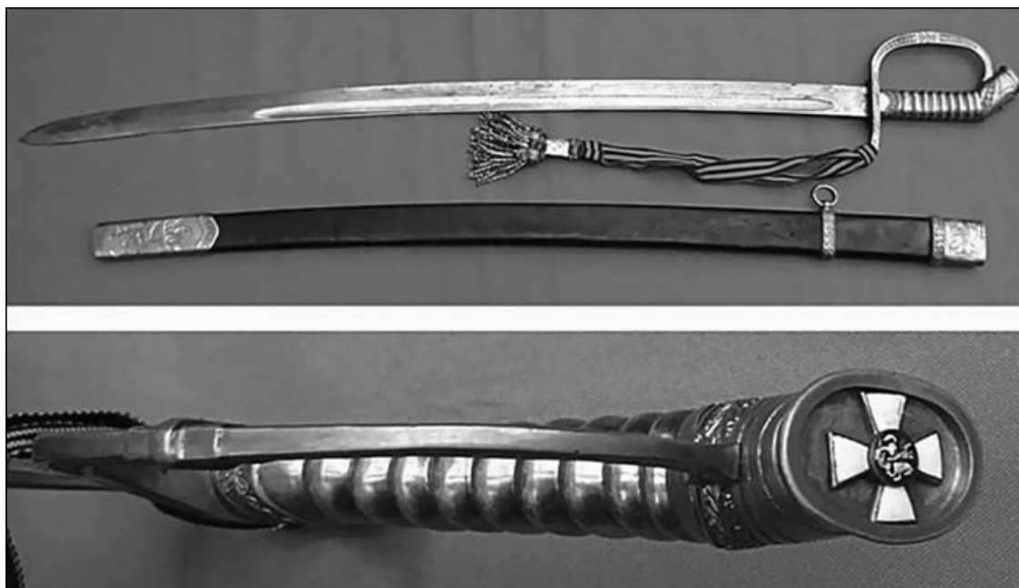
Наградная георгиевская шашка. Конец XIX в.

Первое наградное оружие, врученное в России, сейчас хранится в музее-заповеднике «Царское Село». Эта сабля, золотая надпись на клинке которой гласит о том, что ее пожаловал стольнику Богдану Матвеевичу Хитрово царь Михаил Федорович, правивший в 1613–1645 гг. Но был ли это знак отличия за боевой подвиг или просто знак милости государя – неизвестно. А вот «шпага золотая с богатыми украшениями алмазами», врученная 27 июля 1720 г., досталась князю Михаилу Михайловичу Голицыну за блистательную победу над шведской эскадрой при Гренгаме. С этого дня начинается история наградного оружия России.