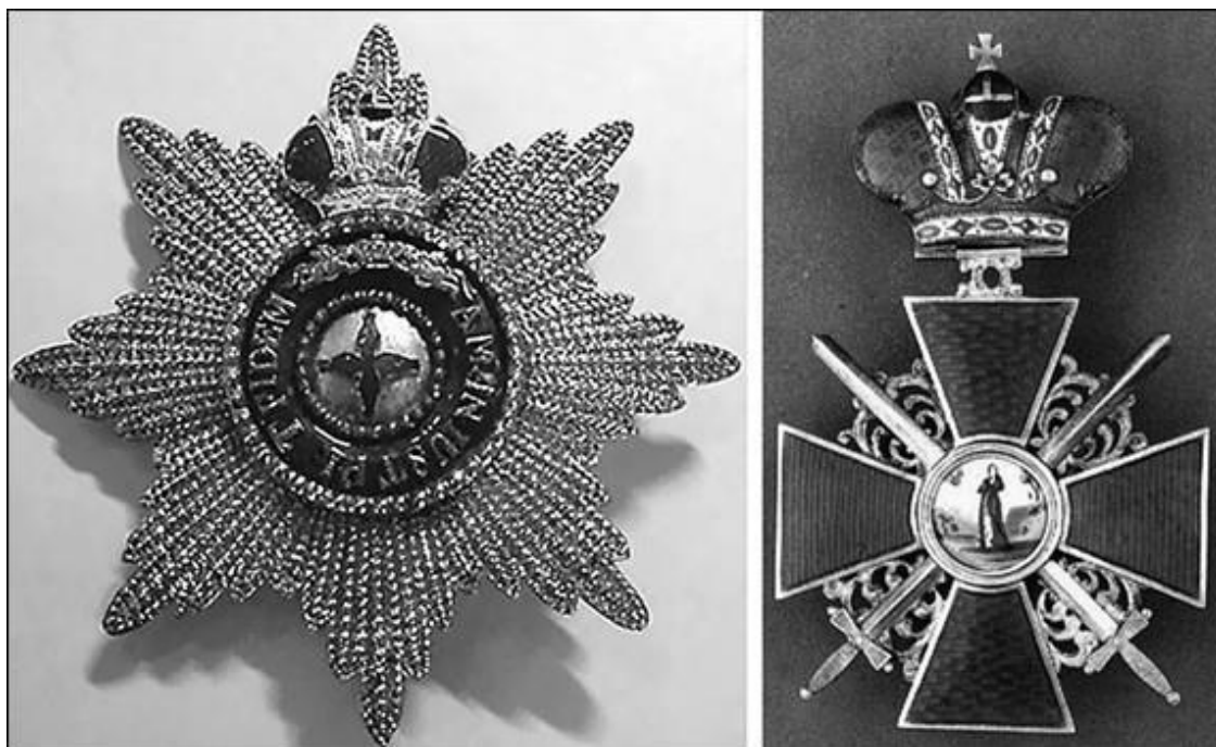
Орден Святой Анны

Один из наиболее распространенных и любимых в России орденов, имевший ласковое прозвище «Аннушка», был учрежден 14 февраля 1735 г. в Голштинском герцогстве. Дело в том, что в 1725 г. правитель этого небольшого немецкого государства герцог Карл-Фридрих женился на дочери Петра I Анне. Но три года спустя она скончалась во время родов, и в память о жене герцог решил создать особую награду. Голштинский орден Святой Анны имел одну степень и мог вручаться очень ограниченному кругу людей – число кавалеров не должно было превышать пятнадцать.