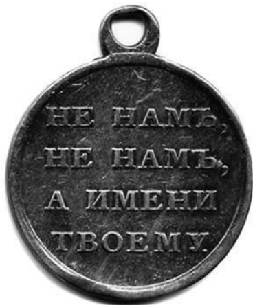
Медаль «В память отечественной войны 1812 года»