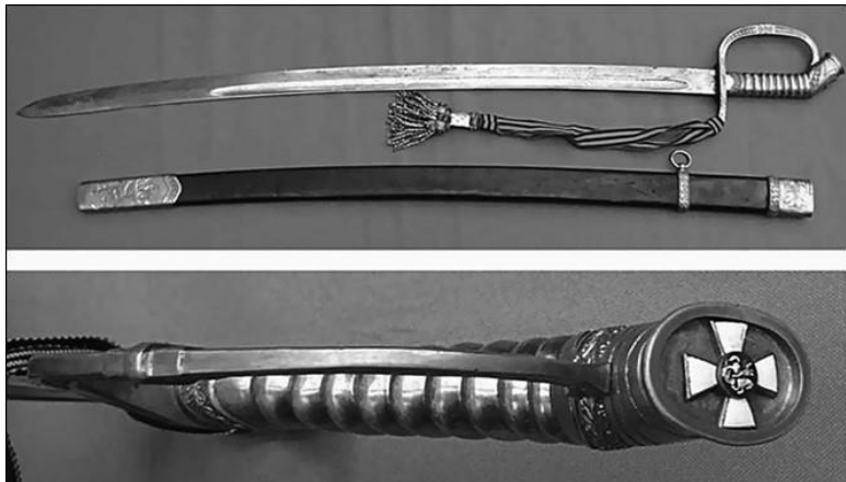
Наградная георгиевская шашка. Конец XIX в.

На протяжении XVIII в. золотое оружие выдавалось высшим русским военачальникам за блестящие подвиги 280 раз. Эфесы таких шпаг были изготовлены из золота (позднее они были просто позолочены сверху), некоторые шпаги украшались также бриллиантами (таких было выдано 80 штук). С июня 1788 г. Золотое оружие впервые начало вручаться не только генералам, но и офицерам. Первые такие шпаги были вручены участникам штурма крепости Очаков; на эфесах восьми шпаг размещалась надпись «За мужество, оказанное в сражении 7 июня 1788 года на лимане Очаковском», а на других двенадцати – та же надпись, но без указания даты. Впоследствии надпись изменилась на «За храбрость». Сначала эти слова гравировались на клинке, эфесе, а с 1790 г.