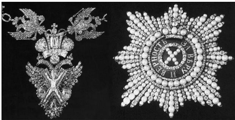
Орден Святого Апостола Андрея Первозванного

который получил название «Андреевский». Поэтому синий Андреевский крест стал знаком нового ордена. На концах этого знака размещались буквы S.A.P.R. (Sanctus Andreus Patronus Russiae – «Святой Андрей покровитель России»). Знак надевался на муаровую голубую ленту, которая носилась через правое плечо. Орденская звезда была восьмилучевой, с девизом «За веру и верность» в центре аверса. В XVIII веке звезда ордена часто вышивалась на одежде, начиная с XIX века она выполнялась из серебра. Звезда носилась на левой стороне груди выше всех прочих наград; в том случае, если орден вручался за боевые заслуги, к знаку и звезде с 1855 г. присоединялись скрещенные мечи. Кроме того, в торжественных случаях знак ордена носился на груди на фигурной цепи.