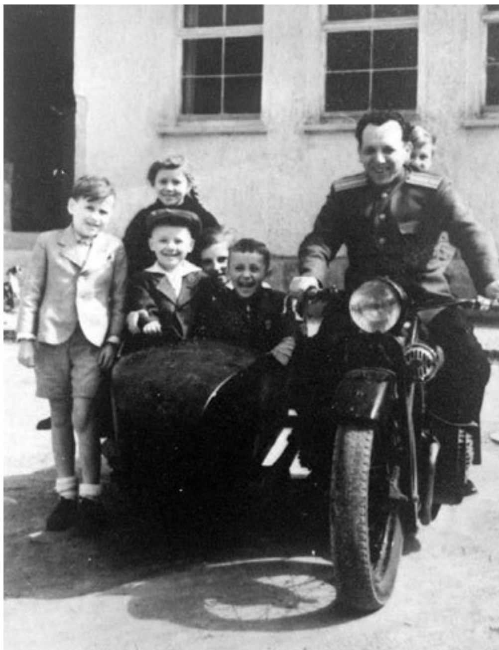
Папа на своем DKW с моей компанией немецких и русских детей.