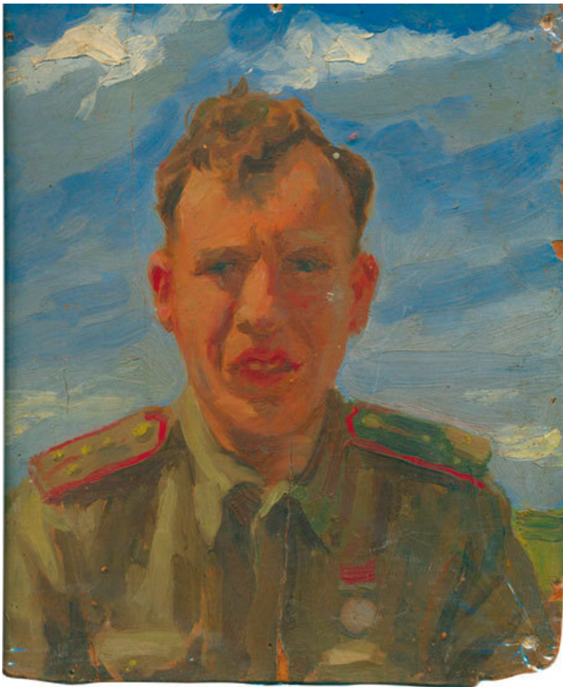
Отец, 1944 год. Портрет кисти фронтового художника Ф. Глебова