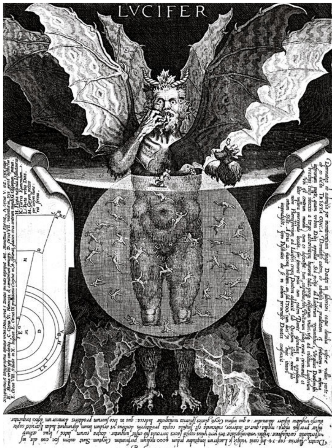
«Люцифер». Гравюра Корнеллиуса Галле по картине Людовико Чиголи. 1591–1650 гг.

Помимо этого вы должны приготовить нож, окунутый в гусиную кровь, который был сотворен в день Меркурия на растущей луне, над которым трижды прочли мессы и Евангелие и окурили вышеупомянутыми благовониями. Этим ножом вы должны делать иссоп, как описано ниже.