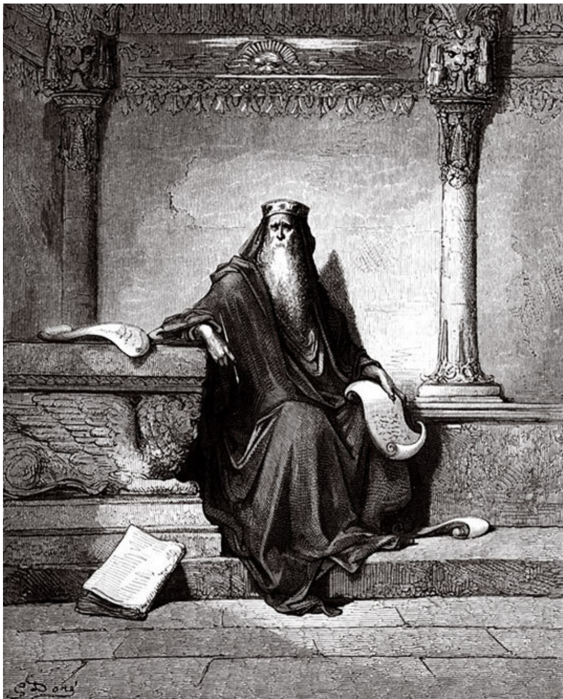
«Царь Соломон В преклонных летах». Гравюра. Художник Поль Гюстав Доре. XIX в. «Все суета сует. Все тщета и ловля ветра». (Соломон. Экклесиаст)