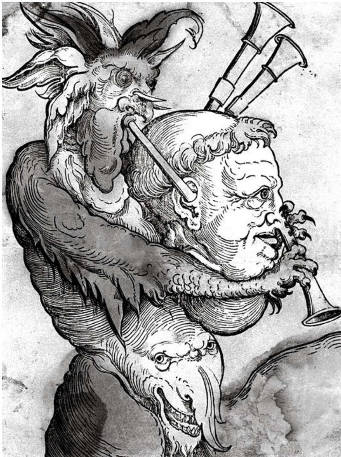
«Дьявол, играющий на волынке, взгромоздившись на монаха». Гравюра Эрхарда Шона по картине Ассафа Кинтцера. Ок. 1530 г.

«Бог, который сотворил все вещи через святое имя, которое записано в семидесяти буквах. Каждая буква содержит одно из священных имен, которые здесь написаны: Ласкос, Хе, Хе, Хе, Ихе, Рипан, Иба, Абгис, Лус, Бафф, Плас, Хапа, Иоб, Иоазакам, Орезеум, Короратор, я прошу, чтобы данный добродетельный эксперимент получился в соответствии с моими желаниями».