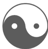
Рис. 2. Схематическое изображение взаимоотношений инь-ян

Мировоззренческую основу древней китайской медицины составляло учение о двух противоположных началах инь и ян. Первоначально иероглифы, используемые для их написания, обозначали явления повседневной жизни. Например, инь означало затемненную сторону предмета, ян – освещенную. Схематическое изображение взаимоотношений инь-ян дано на (рис. 2). Позже инь и ян стали рассматриваться как «силы» или «энергии», или как материальные взаимодополняющие явления (стороны) предметного мира. В связи с этим любое явление, любое существо и каждое из его состояний можно отнести к двум противоположным формам – инь и ян.