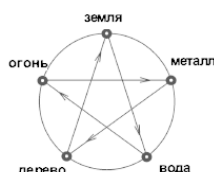
Рис. 7. Закон угнетения

Смысл деструктивных (угнетения) связей противоположен: огонь угнетает (плавит) металл, металл угнетает (режет) дерево, дерево угнетает (подрывает корнями) землю, земля угнетает (впитывает) воду, вода угнетает (тушит) огонь. В этой цепочке противоположные связи оказывают регулирующее действие путем угнетения преобладания одного элемента над другим по так называемому «циклу звезды» (рис. 7). Созидание и угнетение являются двумя неот» емлимыми свойствами у-син (пяти начал). Без созидания нет угнетения, без угнетения нет баланса и координации процесса созидания. Это утверждение применимо и к взаимосвязям в человеческом организме.