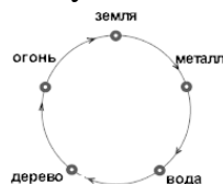
Рис. 5. Закон созидания

Закон взаимодействия пяти элементов проявляется следующим образом: созидание, противосозидание, угнетение, противоугнетение. В представлении древних медиков закон созидания выглядит следующим образом: дерево стимулирует (рождает) огонь, огонь стимулирует (рождает) землю, земля стимулирует (рождает) металл, металл стимулирует (рождает) воду, вода стимулирует (питает) дерево). Созидающая связь оказывает стимулирующее действие; в ней каждый последующий элемент усиливается предыдущим элементом (рис. 5, 6).