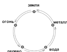
Рис. 6. Закон противосозидания

Смысл деструктивных (угнетения) связей противоположен: огонь угнетает (плавит) металл, металл угнетает (режет) дерево, дерево угнетает (подрывает корнями) землю, земля угнетает (впитывает) воду, вода угнетает (тушит) огонь. В этой цепочке противоположные связи оказывают регулирующее действие путем угнетения преобладания одного элемента над другим по так называемому «циклу звезды» (рис. 7). Созидание и угнетение являются двумя неот» емлимыми свойствами у-син (пяти начал). Без созидания нет угнетения, без угнетения нет баланса и координации процесса созидания. Это утверждение применимо и к взаимосвязям в человеческом организме.